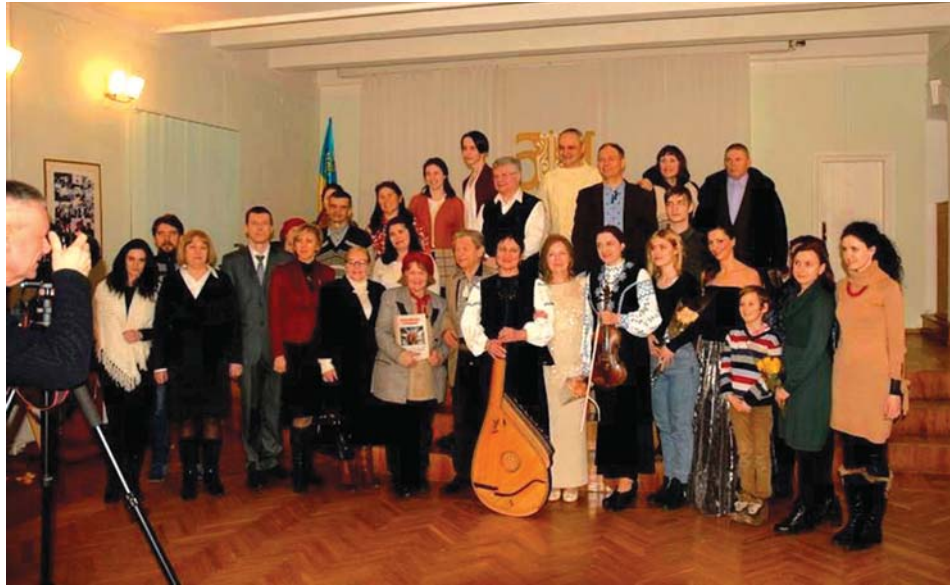
Світлина із заходу до 100-річчя від дня народження Л. В. Забашти у рамках проекту “Мистецькі зустрічі в Архіві-музеї”. 28 лютого 2018 р.

200-річчя від дня народження автора твору М. М. Петренка. У лютому 2018 р. відбувся літературно-мистецький захід “Світова класика українською” до 100-річчя від дня народження української поетеси Л. В. Забашти. Ведучою вечору виступила українська акторка театру і кіно, драматург, політик, народна артистка України Л. Хоролець. Згадані вище зустрічі супроводжувалися одноденними стаціонарними виставками документів, що відбивали основні віхи життя та творчості митців.