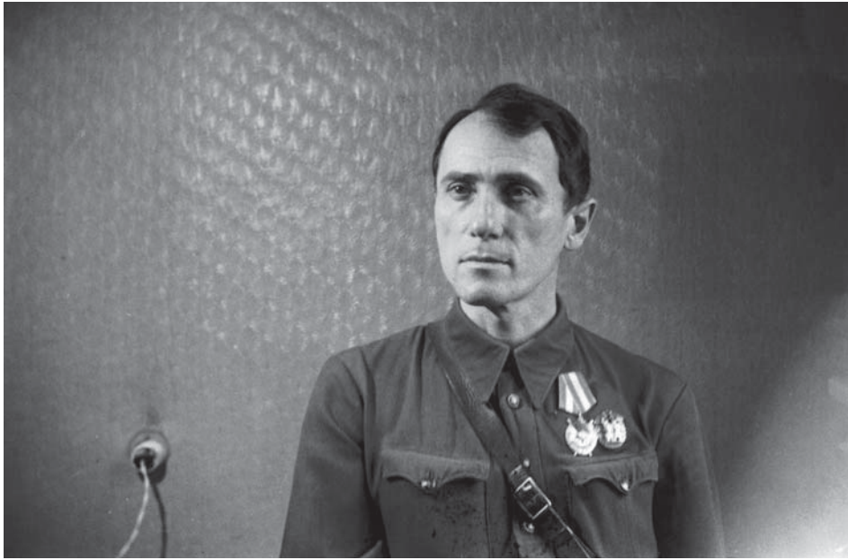
В. М. Сосюра, м. Київ, 1944 р.