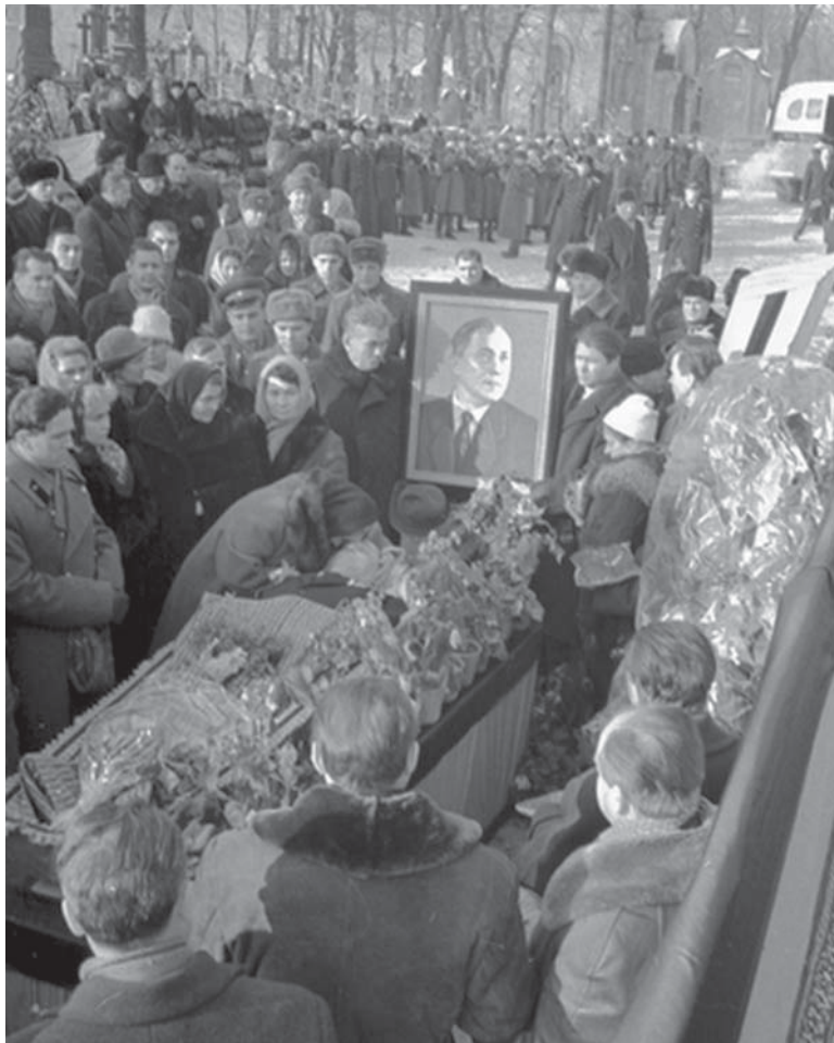
Похорон В. М. Сосюри, м. Київ, 11 січня 1965 р.

Отже, як свідчить розглянутий матеріал, аудіовізуальні документи, присвячені В. Сосюрі, – різноманітні за жанром та змістовим наповненням. Завдяки технічним характеристикам вони зберігають унікальну візуальну й вербальну інформацію, допомагають реконструювати