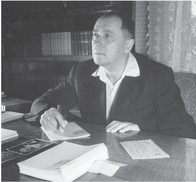
В. М. Сосюра, м. Київ, 1962 р. ЦДКФФА України ім. Г. С. Пшеничного, од. обл. 2-65919.