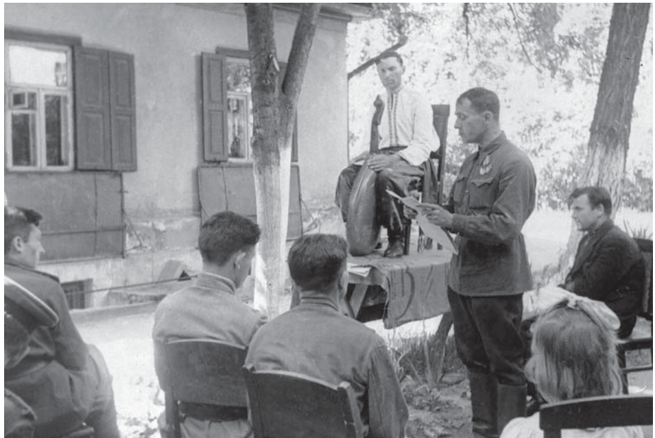
В. М. Сосюра читає власні поезії біля меморіального будинку-музею Т. Г. Шевченка на Пріорці, м. Київ, червень 1944 р.

ЦДКФФА України ім. Г. С. Пшеничного, од. обл. 0-172535.