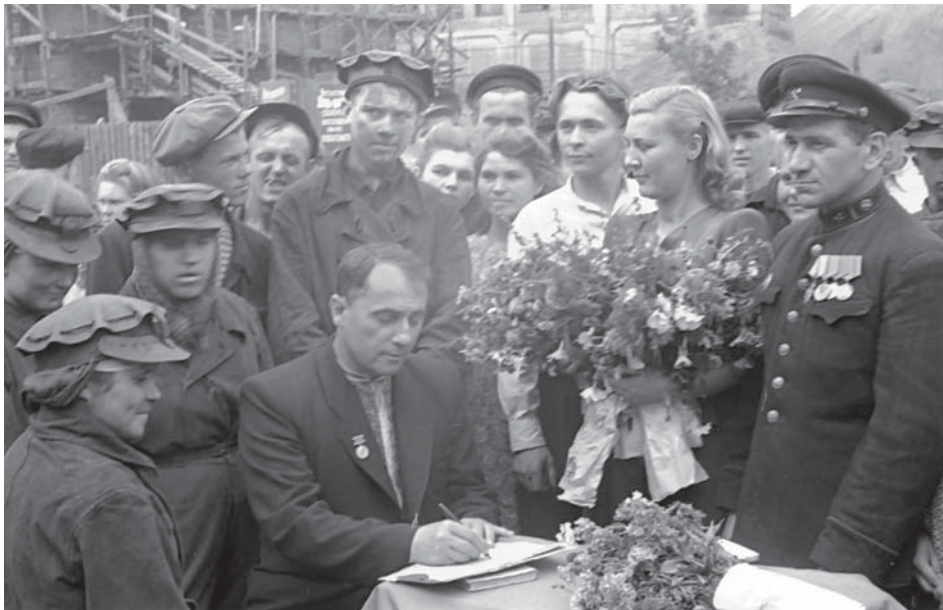
В. М. Сосюра підписує свою збірку поезій в дарунок комсомольцям шахти № 4–5 “Микитівка” тресту “Горлівськвугілля” під час зустрічі групи письменників з гірняками, м. Горлівка Сталінської області, 21 серпня 1950 р. ЦДКФФА України ім. Г. С. Пшеничного, од. обл. 0-29605.