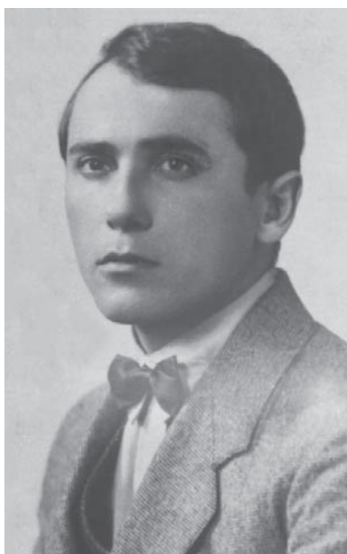
Український поет В. М. Сосюра, м. Харків, 1920-і роки. ЦДКФФА України ім. Г. С. Пшеничного, од. обл. 0-156598.

Кілька сюжетів присвячено відзначенню внеску В. Сосюри в літературу та мистецтво, зокрема, нагородження поета орденом Леніна (“Радянська Україна”, 1948 р., № 2, од. обл. 433), ювілейний вечір до 50-річчя від дня народження та 30-річчя творчої діяльності (“Радянська Україна”, 1948 р., № 3, січень, од. обл. 434), вручення диплома та медалі лауреата Премії імені Т. Г. Шевченка (“Радянська Україна”, 1963 р., № 15, од. обл. 2668; Збірник кіносюжетів, 1963 р., сюж. 1, од. обл. 4278).