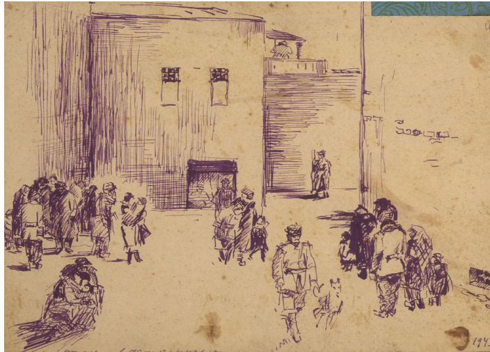
Картина І. В. Лисицина “У фашистській тюрмі”. 1943 р. Держархів Чернігівської обл., ф. Р-1375, оп. 1, спр. 12, арк. 40.

отримав звання вченого малювальника з правом викладання малювання в середніх навчальних закладах.