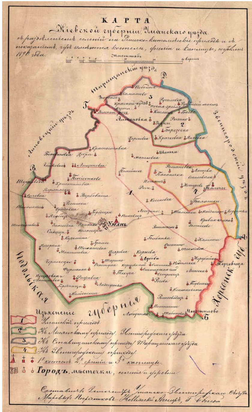
Карта Уманського повіту Київської губернії з розділенням на римсько-католицькі парафії. 1870 р.