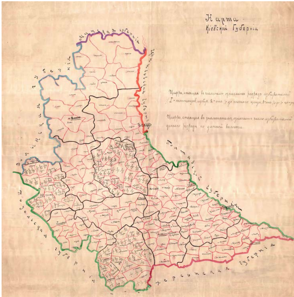
Карта Київської губернії із зазначенням виборчих ділянок. 2-а половина XIX ст. Папір, кольорова. 77x70 см.

Державний архів Київської області. Ф-1542. Колекція карт і креслень. Оп. 1. Спр. 2275. Арк. 1.