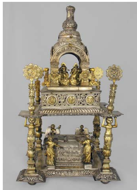
Дарохранительница, [перша полов. XVIII ст.], майстер Семен Тарановський. (срібло, золочення, карбування) Філія НМІУ– МІКУ. Інв. № ДМ4545.

висновок, що на початку XIX ст. “... приток з Росії золотарських оправ, як і взагалі золотарських виробів робиться остільки сильним, що нищить місцеве виробництво і майстерні старих майстрів з певними традиціями, а ті приїзжі майстри, які засновують свої підприємства в Києві та інших значних центрах, позбавлені місцевих традицій” 5 .