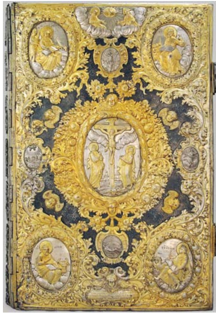
Оправа Євангелія, 1722 р., майстер Ієремія Білецький. (срібло, золочення, чернь, карбування). Філія НМІУ – МІКУ. Інв. № ДМ4371.