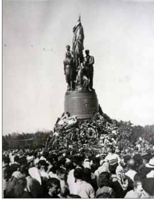
Открытие памятника молодогвардейцам в г. Краснодоне. 1950 год.