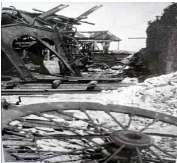
Шахта № 5, где были расстреляны члены подпольной комсомольской организации “Молодая гвардия”. 1943 год.