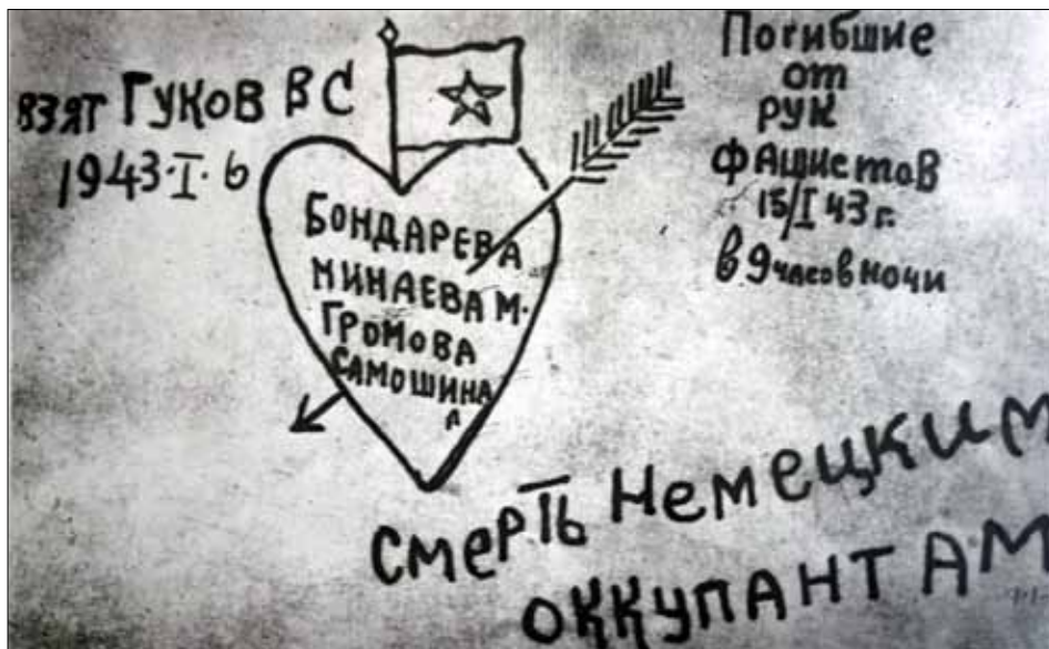
Надпись членов подпольной комсомольской организации “Молодой гвардии” на стене тюрьмы. 1942–1943 года. Госархив Луганской обл. ф. П-7118, оп.1, д. 660.

ное химическим карандашом сердце, а в середине надпись: “Здесь сидели Шура Бондарева, Уля Громова, Лина Самошина, Нина Минаева”, а чуть ниже: “Смерть фашистским оккупантам!”. В камере пыток жена нашла одеяло, сплошь залитое кровью, оно принадлежало Майе Пегливановой.