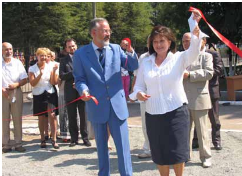
Урочиста церемонія початку будівництва Комплексу споруд центральних державних архівних установ України (м. Київ). На передньому плані зліва направо: Віце-прем'єр-міністр України Д. В. Табачник, Голова Державної архівної служби України О. П. Гінзбург.