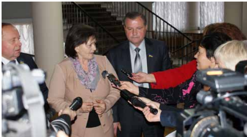
Всеукраїнський семінар з питань створення розгалуженої мережі трудових архівів (м. Житомир, Україна). Зліва направо: голова Житомирської обласної ради Й. А. Запаловський, Голова Державної архівної служби України О. П. Гінзбург та перший заступник голови Житомирської обласної державної адміністрації М. М. Олещенко.