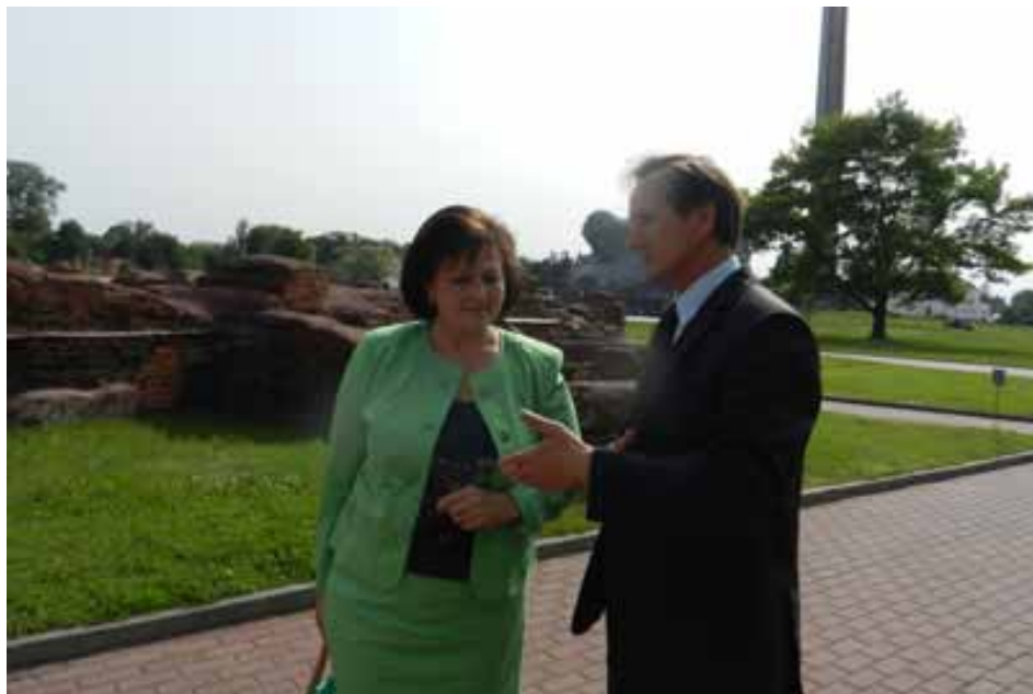
Голова Державної архівної служби України О. П. Гінзбург та директор Державної установи «Меморіальний комплекс Брестська фортеця-герой» Г. Г. Бисюк. (м. Брест, Республіка Білорусь).