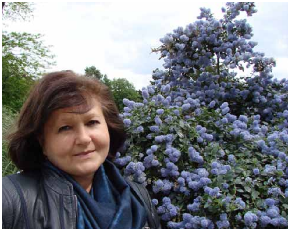
Під час перебування української делегації архівістів у м. Париж, Франція.