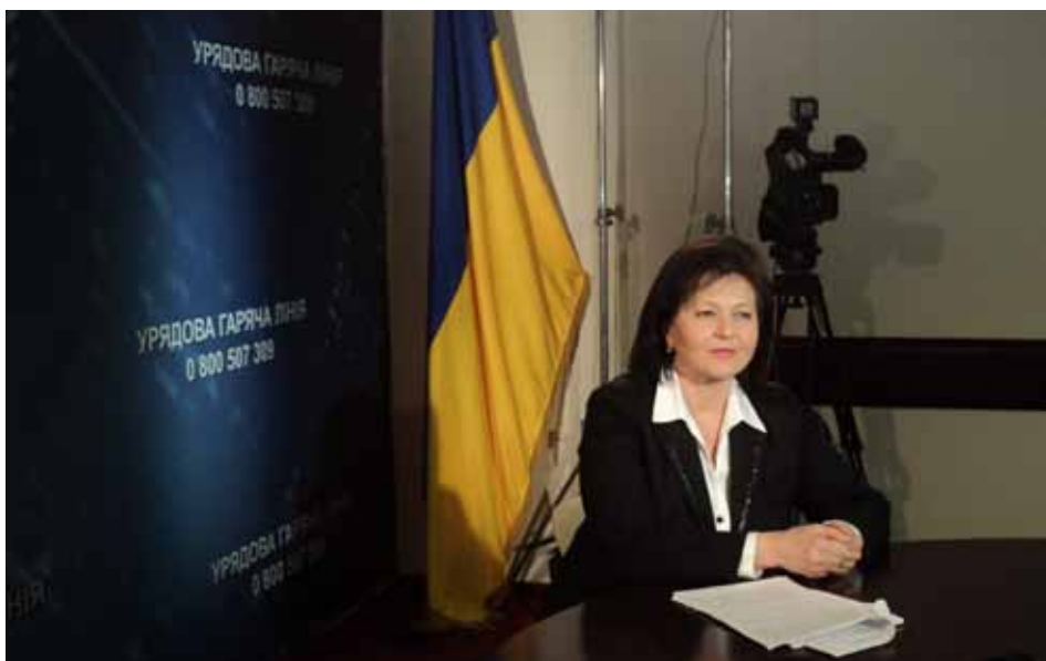
Під час прямої телефонної лінії Кабінету Міністрів України.