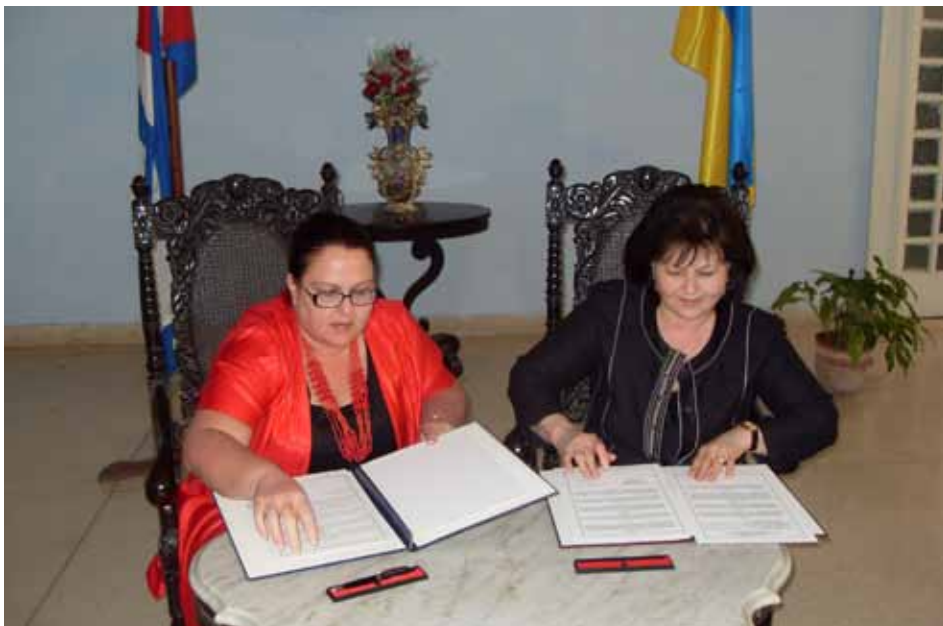
Під час підписання Договору про співробітництво між Державною архівною службою України та Національним архівом Республіки Куба (м. Гавана, Куба). Зліва направо: Генеральний директор Національного архіву Республіки Куба М. Марчена, Голова Державної архівної служби України О. П. Гінзбург.