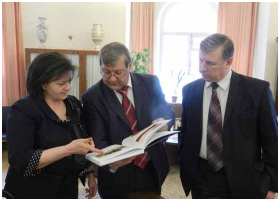
Керівник Федерального архівного агентства Росії А. М. Артизов та його заступник В. П. Тарасов знайомлять О. П. Гінзбург з останніми документальними виданнями, підготовленими російськими архівістами (м. Москва, Росія).