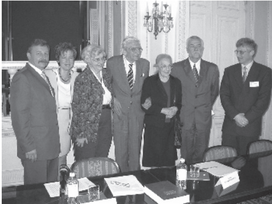
У колі друзів і колег під час презентації “Руської (Волинської) Метрики” в АГАД. Варшава, травень 2003 р.

проблематики королівської канцелярії, з якою значною мірою пов’язана тема королівських радників 17 . У наступні роки вона проводила інші ґрунтовні дослідження – цим разом над Литовською Метрикою. Їхні результати були опубліковані в часопису “Archeion” 18 . Після цього разом з проф. Патріцією Кеннеді-Грімстед з Гарварду брала активну участь у дослідженнях 19 Литовської Метрики та перевиданнях історичного опису 20 Литовської Метрики, складеного Станіславом Пташицьким у 1887 р. Цей опис засвідчує розпорошення апарату Метрики переважно між Варшавою (АГАД) і Москвою (ЦГАДА) і подає сучасні архівні шифри.