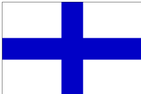
Стяг Лиманської козацької флотилії

ням стосовно майбутнього Чорноморського флоту, на кораблях якого були вже підняті німецькі прапори. Окрім того, переговори провадились і з більшовицькою Росією і, зрозуміло ж, з Антантою.