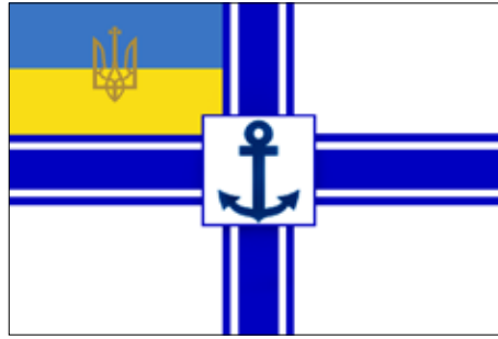
Прапор міністра морських справ

Отож 29 квітня 1918 р. на лінкорі “Георгій Победоносець” був піднятий сигнал контр-адмірала Сабліна: “Вступив у командування українським Чорноморським флотом”. Німецьке командування отримало радіограму-депешу про цю подію, у якій командувач контр-адмірал Саблін просив терміново прийняти його делегацію. Після цього відбулася вікопмна подія для моряків-українців, кораблі Чорноморського флоту, на яких екіпажі нейтралізували більшовицькі осередки, підняли