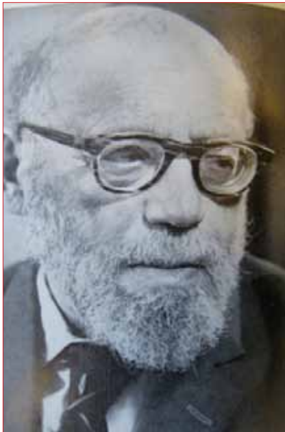
Бенціон Діну́р, фундатор архівної системи держави Ізраїль, Міністр освіти і культури Ізраїлю

рошені численними архівами країн діаспори, хоча б і єврейськими. Історики добре усвідомлювали той факт, що досліджувати єврейську історію, а тим більше в Ізраїлі, неможливо без створення загального архіву історії єврейського народу в Єрусалимі, який би зібрав архівні документи з усіх країн світу.