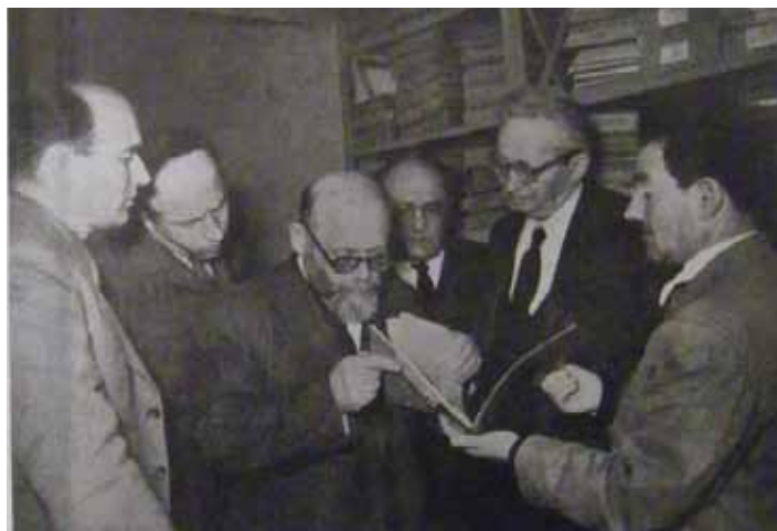
Директор Меморіального комплексу Яд Вашем, професор Бенціон Діну́р показує Президенту Ізраїлю Іцхаку Бен Цві документи Архіву Яд Вашем

освіти між євреями. В Києві Діну́р викладав єврейську історію та брав участь у розробленні програми діяльності Єврейської історико-археографічної комісії Всеукраїнської академії наук. В Одесі Діну́р читав лекції в Інституті народної освіти, був активним учасником громадських і літературних заходів 37 . Діну́р добре усвідомлював значущість документального архіву для формування національної історичної науки в Ерец-Ізраель. Відбуваючи у червні 1921 р. з Одеси до Єрусалима, він накреслив план найважливіших справ, які мав на меті зробити,