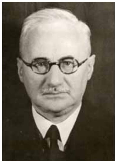
Ойген Тойблер (1879–1953 рр.) Перший директор “Загального архіву німецьких євреїв”

знані; історик Мартін Філіппсон, перший Голова правління архіву; Ойген Тойблер, перший директор архіву 24 . У 1908–1914, 1929–1939 рр. архів видавав журнал “Mitteilungen des Gesamtarchivs der Deutschen Juden”, в якому публікував тексти історичних документів та статті з теорії архівної справи. Нацисти використовували матеріали архіву для генеалогічних досліджень з метою сертифікації арійської раси. До цієї роботи Управління з генеалогічних досліджень Рейху примусило й останнього директора архіву Якоба Якобсона 25 . Більша частина архіву (фонди 800 общин) в 1951–1954 рр. надійшла на зберігання до Центрального архіву історії єврейського народу в Єрусалимі.