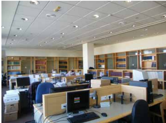
Читальна зала Архіву Яд Вашем. Фото Л. Левченко, 2014 р.