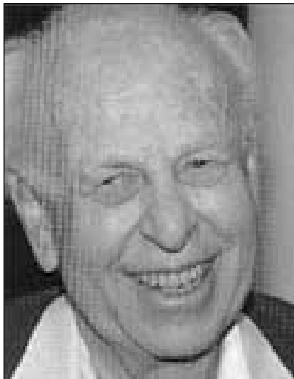
Державний архівіст Ізраїлю, професор Авраам Пол Алсберг (1919–2006, Архівіст у 1971–1990 рр.)

ментами, створеними державою, та документами, якими держава володіє. Більше того, законодавці закріпили певні обов'язки за власниками приватних архівів стосовно документів з історії єврейського народу та Землі Ізраїлю, особливо в частині їхнього переміщення за межі держави, а також не обійшли увагою документи сіоністського, релігійного та іноземного походження. Однак, як зазначав П. Алсберг, за перші 30 років дії закону Державний архівіст із політичних міркувань ніколи не поширював свою владу на архіви християнських та мусульманських інституцій та приватних осіб 49 .