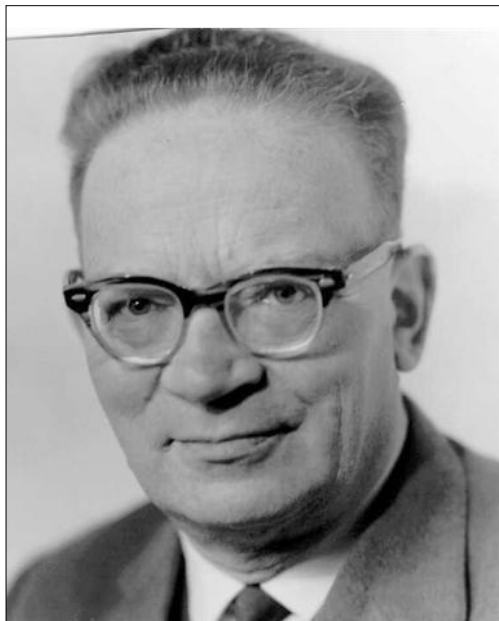
Перший Державний архівіст Ізраїлю, д-р. Алекс Бейн

уряд Ізраїлю. Отже, в сучасному архіві сконцентровано не лише численні документи різних напрямів робітничого руху, профспілок, а й із розвитку економіки, промисловості, фінансової і банківської сфери, державотворення в Ізраїлі 36 . Сьогодні архів знаходиться в скрутних умовах, його виселено зі спеціально збудованого приміщення в центрі Тель-Авіву і розміщено в шкільній будівлі, а штат працівників скорочено до п'яти осіб. Однак, це не означає зменшення цінності документів, якими дбайливо опікуються архівісти Ізраїлю.