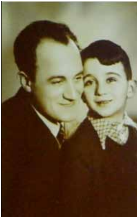
Засновник і керівник архіву Варшавського гетто “Онег Шаббат” Емануель Рінгельблум із сином Урі

був автором майже 130 праць про історію євреїв Польщі, брав участь у сіоністському русі та Всесвітньому сіоністському конгресі в Женеві (1939), роботі “Joint”. Перші кроки до заснування архіву Рінгельблум зробив у жовтні 1939 р. як голова єврейської організації соціальної самопомоги “Координація”. Делегації з провінційних міст Польщі щодня прибували до офісу, щоб розповісти про страждання польського єврейства, а вчений записував їхні історії. Згодом він почав, спершу щотижня, пізніше – щомісяця, писати огляди та есе про знищення єврейської інтелігенції, нацистську політику в єврейському питанні. Із заснуванням Варшавського гетто архів “Онег Шаббат” функціонував як справжній архівний заклад із постійними співробітниками, серед яких були: Авраам