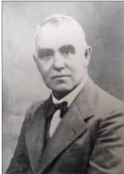
Ілля Чериковер, (1881–1943 рр.) – засновник Історичного архіву східних євреїв

1921 р. у Берліні українськими євреями-емігрантами на чолі з уродженцем Полтави Іллею Чериковером (1881–1943) засновано “Ostjüdisches Historisches Archiv” (“Історичний архів східних євреїв”) з метою концентрації документів про єврейські погроми в Україні під час громадянської війни. Початок архіву був покладений ще в Україні (Київ, 1919 р.) 32 . Дружина Чериковера, Ривка, упорядкувала архів і створила картковий каталог. Оскільки публікація документів архіву через політичні причини була неможливою в більшовицькій країні, у квітні 1921 р. з допомогою литовських дипломатів архів таємно вивезли через Москву та Ковель до Німеччини. Фінансову підтримку архіву надавали “Joint” та українські євреї США. Директор