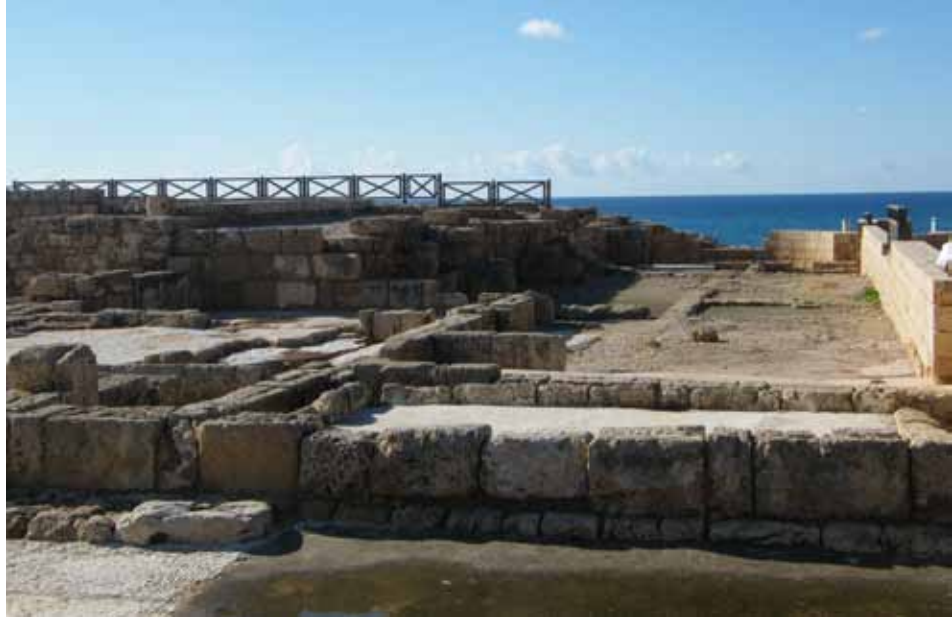
Розкопки архіву Податкової служби у місті Кесарія Палестинська.