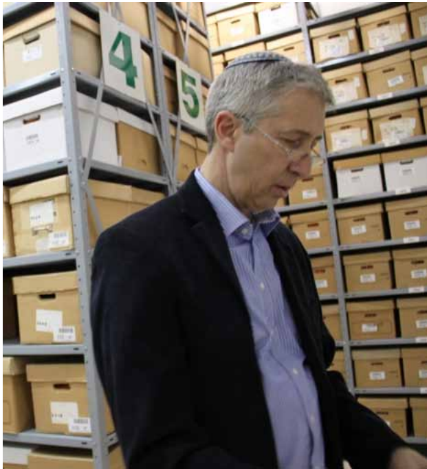
Державний архівіст Ізраїлю, д-р. Яков Лозовік (з серпня 2011 р.).

із ним пов'язані. Наприкінці засідання Вища архівна рада ухвалила рішення рекомендувати Прем'єр-Міністру призначити Алекса Бейна першим Державним архівістом Ізраїлю 55 . Він очолював архівну галузь Ізраїлю до березня 1971 р. Після нього на посаду Державного архівіста було призначено видатного ізраїльського історика-архівіста, професора Авраама Пола Алсберга (1971–1990), за ним професора Ревена Ярона (1990–1992), далі – професора Івіатара Фрізела (1993–2001), доктора Тувія Фрілінга (2001–2004), доктора Іехошуа Френдіха (2005–2011). Сьогодні архівною галуззю Ізраїлю керує Державний архівіст, доктор Яков Лозовік (з 2011 р.), який раніше очолював Архів Яд Вашем*. Зміни до архівного закону Ізраїлю вносилися 1964 р., 1981 р. та 2009 р. Зокрема, вони стосувалися удосконалення процедури розсекречування документів, які зберігаються в Державному архіві Ізраїлю, приватних архівів та електронних документів 56 .