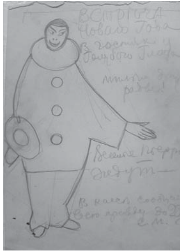
Є. А. Агафонов. Ескіз афіші театру “Голубой глаз”, 1911. ЦДАМЛМ України, ф. 553, оп. 1, од. зб. 82, арк. 18 зв.

в групі з подружжям Коньонкових (Нью-Йорк, 1930-ті?) (спр. 96); фотографія колишнього будинку матері Є. А. Агафонова, в якому знаходилася майстерня-студія “Блакитна лілія” (Харків, [вул. Чернишевська, буд. 33], 1961) (спр. 97).