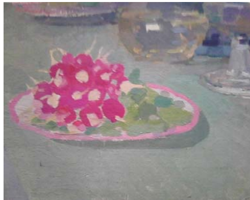
Є. А. Агафонов. “Натюрморт с пучком редиски”, 1910. ЦДАМЛМ України, ф. 553, оп. 1, од. зб. 79.

Завершують блок копії світлин Є. А. Агафопова: індивідуальна фотографія художника за роботою в майстерні (Нью-Йорк, 1931) (спр. 95) та