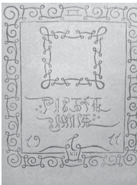
Альманах “Голубая лилия”, 1911 ЦДАМЛМ України, ф. 145, оп. 1, од. зб. 145.