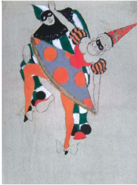
С. Щербаков. Рисунок для квитка безпрограшної лотереї, що проводилася в студії “Будяк”. Офорт, 1913–1914. ЦДАМЛМ України, ф. 553, оп. 1, од. зб. 124, арк. 3.

Окремий блок складають етюди художників О. В’юнченка, [М.?] Головашова, [Й.?] Запорожця, О. О. Рибникова, О. Чирикової; ескізи, начерки та рисунки П. Гладкова, О. М. Грота, Н. І. Кравцової, М. В. Лібакова, В. Талієва та інших художників за 1906–1914 рр. (спр. 126–141).