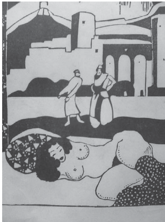
Ф. І. Надєждін. Гравюра, 1912–1913. ЦДАМЛМ України, ф. 553, оп. 1, од. зб. 113, арк. 8.

Творчість В. І. Пичети (1889–?) у фонді висвітлюють пейзажний етюд – картон, олія (1907) (спр. 119) та ескіз гравюри (1911) (спр. 120).