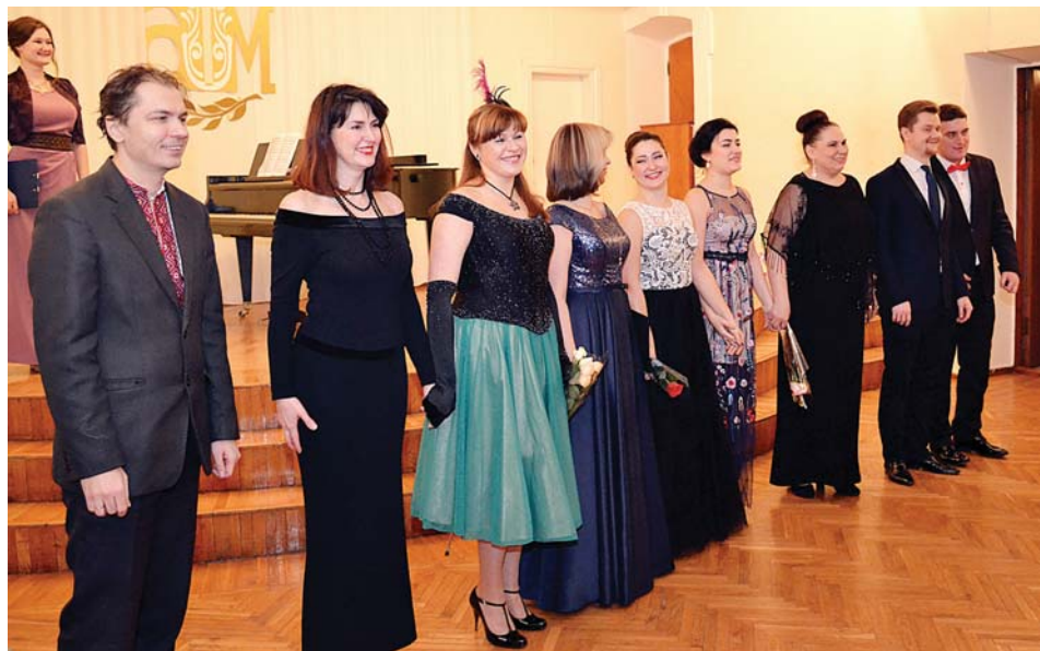
Світлина із заходу “Світова класика українською” у рамках проекту “Територія АРХІВ: діалог з документом”. 30 січня 2018 р.