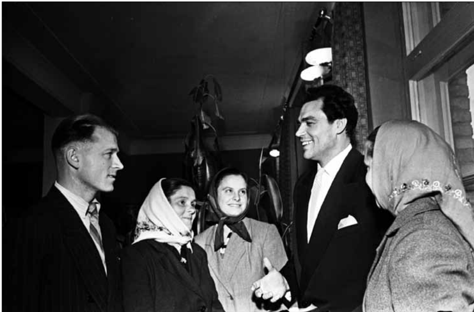
Народний артист СРСР Д. М. Гнатюк (2-й праворуч) під час бесіди з відвідувачами музею с. Ксаверівка Гребінківського району Київської області. 1960 р. Автор зйомки – Я. Б. Давидзон. ЦДКФФА України ім. Г. С. Пшеничного, од. обл. 0-209221.