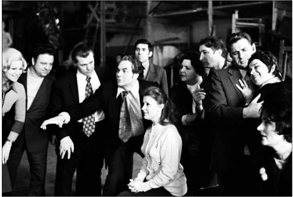
Народний артист СРСР Д. М. Гнатюк (у центрі) проводить репетицію опери І. І. Дзержинського “Тихий Дон” з артистами Державного театру опери й балету УРСР ім. Т. Г. Шевченка. 3-й ліворуч – народний артист СРСР А. Ю. Мокренко. Київ, 27 січня 1976 р.