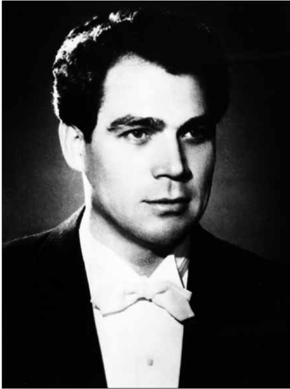
Народний артист УРСР Д. М. Гнатюк – соліст Державного театру опери й балету УРСР ім. Т. Г. Шевченка. 1950-і рр.