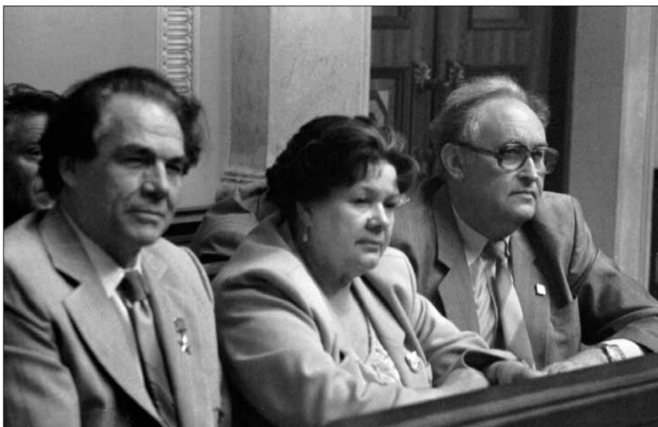
Гості ІХ з'їзду письменників УРСР (зліва направо): народні артисти СРСР Д. М. Гнатюк, О. Я. Кушенко й архітектор І. М. Седак у залі засідань. Київ, 5–7 червня 1986 р. Автор зйомки – І. М. Яїцький. ЦДКФФА України ім. Г. С. Пшеничного, од. обл. 0-162665.