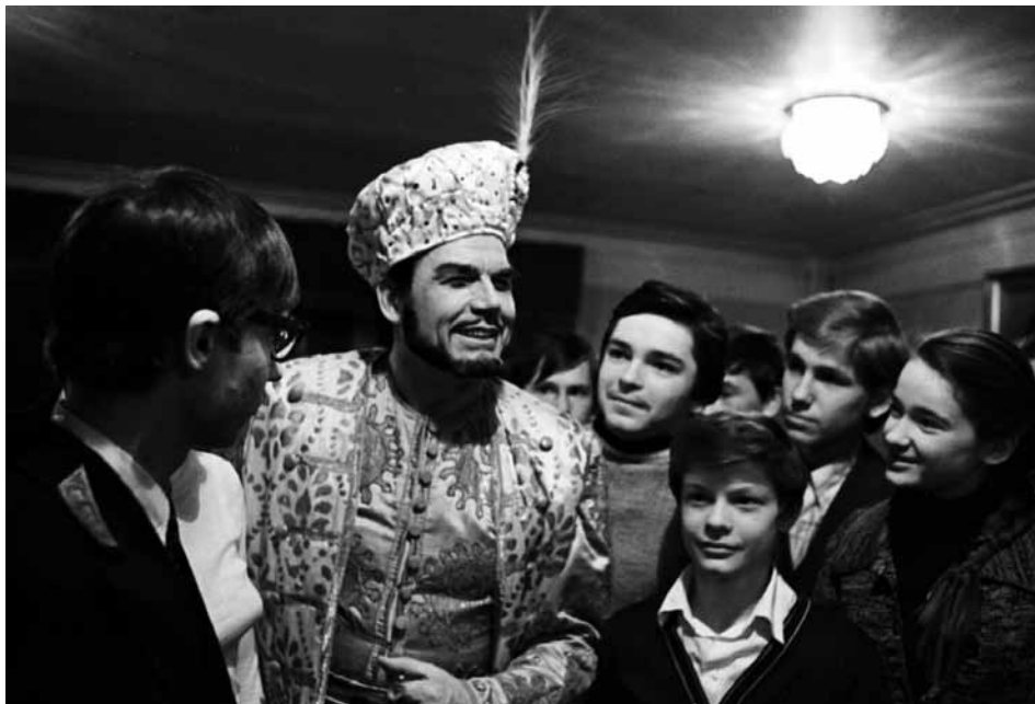
Соліст Державного театру опери й балету УРСР ім. Т. Г. Шевченка, народний артист СРСР Д. М. Гнатюк під час розмови з учнями профтехучилища м. Києва. 10 лютого 1980 р.