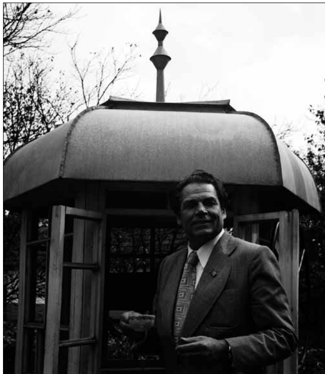
Народний артист СРСР Д. М. Гнатюк біля криниці в рідному с. Новосілка Кіцманського району Чернівецької області. Червень 1979 р. Автор зйомки – В. А. Репік. ЦДКФФА України ім. Г. С. Пшеничного, од. обл. 2-147706.