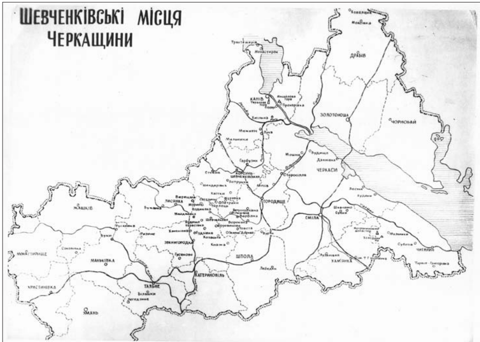
Мапа Шевченківських місць Черкащини.