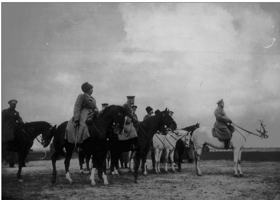
Огляд військ російської армії імператором Миколою II. 1-й зліва генерал Ф. Келлер. м. Хотин (тепер Чернівецька обл.). З фондів ЦДКФФА України ім. Г. С. Пиєничного, од. обл. 2-147030