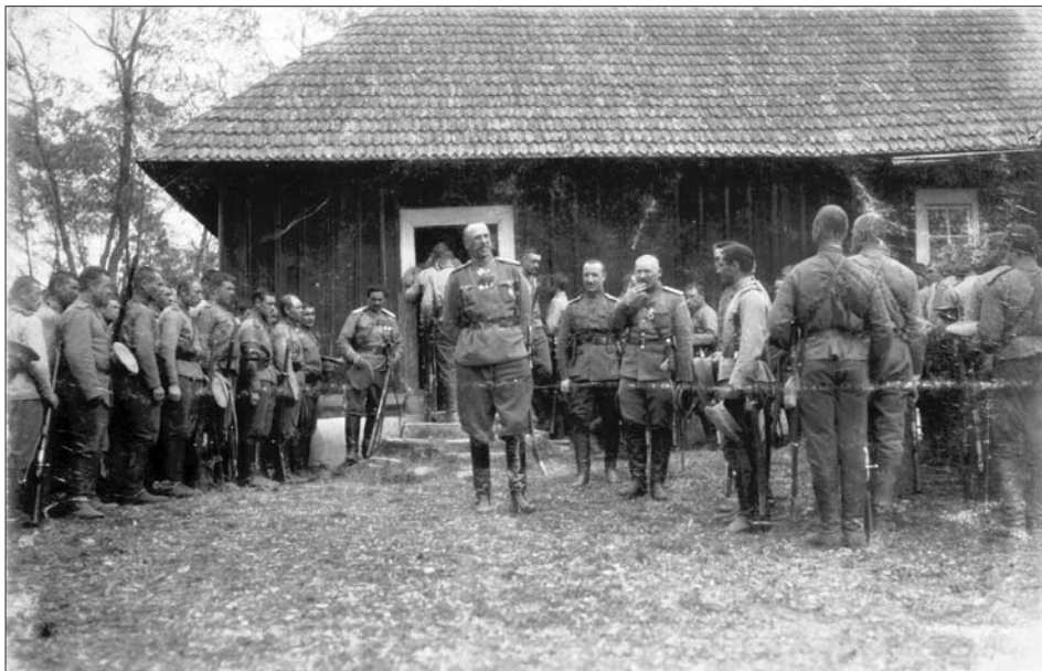
Командир 3-го кінного корпусу генерал Ф. Келлер і улани в с. Тарасівці. Тепер Новоселицький р-н Чернівецької обл., 1916 р.