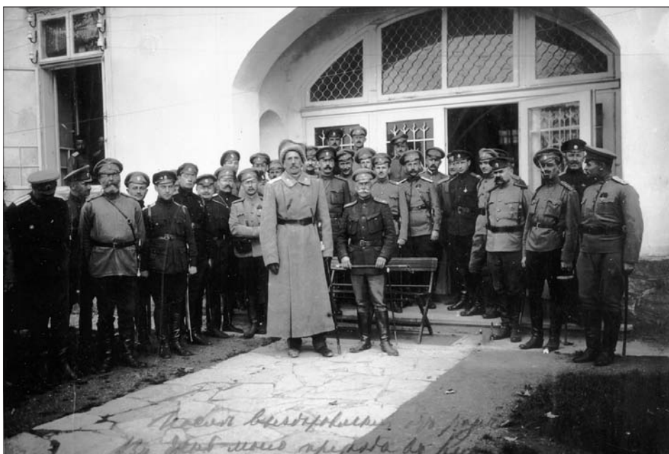
Група офіцерів російської армії. Попереду командир 3-го кінного корпусу генерал Ф. Келлер (зліва) і його заступник генерал Рєрберґ. м. Кімполунг (Буковина), 1916 р. З фондів ЦДКФФА України ім. Г. С. Пиєничного, од. обл. 2-147038