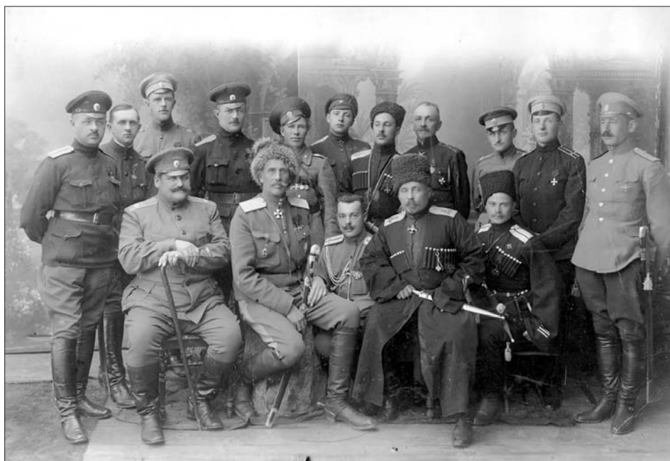
Генерал Ф. А. Келлер з проводжаючими його офіцерами перед від'їздом з м. Кишинева. 1917 р. З фондів ЦДКФФА України ім. Г. С. Пиєничного, од. обл. 2-147035