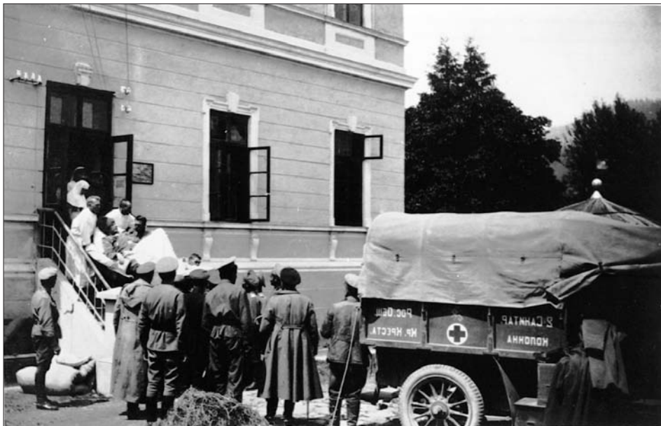
Розвантажування санітарної машини з пораненим генералом Ф. Келлером біля госпітalia російської армії. м. Кімполунг (Буковина), 1916 р.