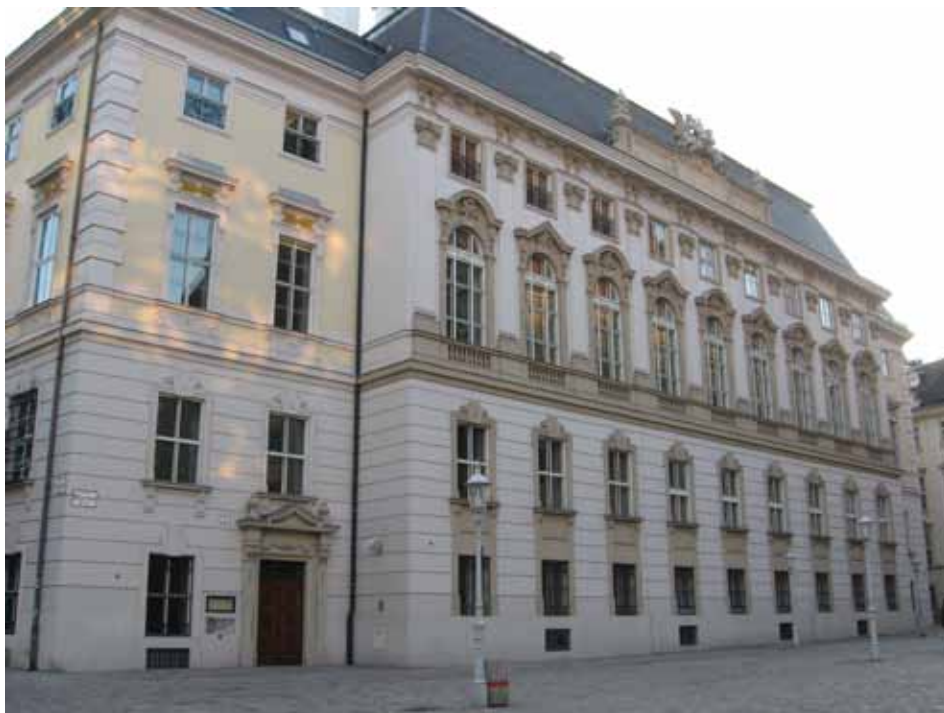
Австрійський державний архів у Відні.

ня безцінної вартости матеріалів, записок, а може й початих і не закінчених більших праць одної із найбільших духових та інтелектуальних величин і талантів України, обдарованих Богом і генієм української землі” 19 .