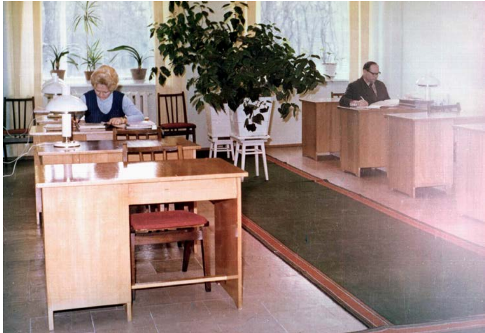
Читальний зал партійного архіву. Січень 1976 р.

відбулася у селищі Татарбунари. Для досвіду співробітники архіву відвідали партійні архіви Ворошилоградського, Львівського, Київського обкомів Компартії України і партійний архів Інституту історії партії ЦК Компартії Молдавії 85 .