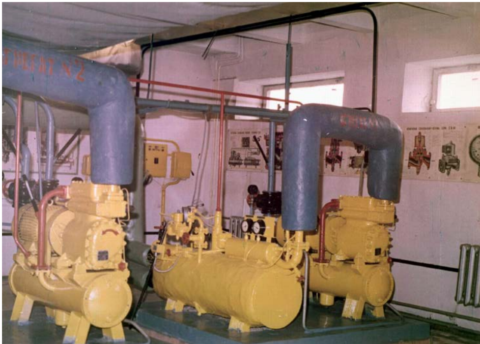
Машинне відділення партійного архіву. Січень 1976 р.