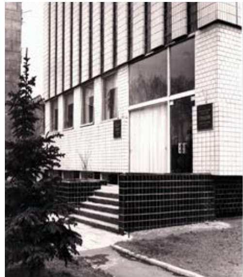
Фасад будівлі партійного архіву Одеського обкому Компартії України, січень 1976 р.

Після переїзду роботу архіву було поновлено. У 1973 році переплетено й відреставровано 1636 справ (44000 аркушів), зроблено копії 1608 аркушів згасаючого тексту. Почато ро-