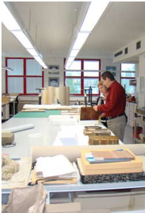
Реставраційна лабораторія Архіву головного міста Праги.

Оскільки одним із завдань делегації України було ознайомлення з довідковим апаратом Національного архіву Чеської Республіки з метою виявлення документів категорії “Зарубіжна архівна українка”, під час відвідин архівів, які презентують три рівні архівної системи Чехії, було проведено попереднє ознайомлення з науково-довідковим апаратом