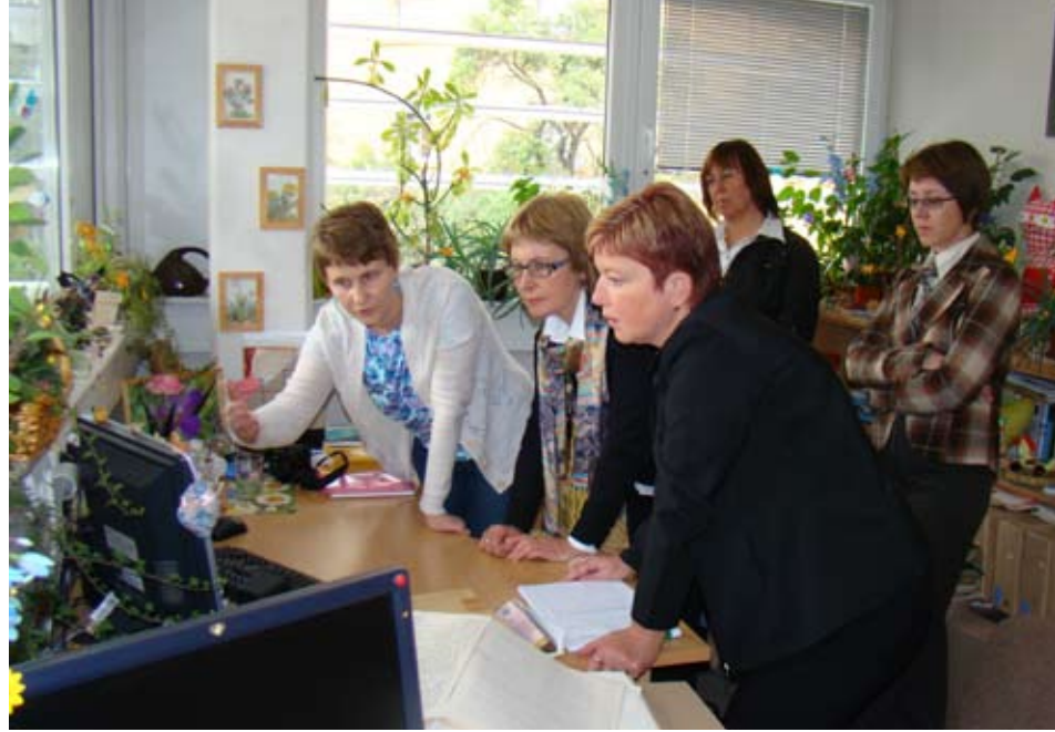
Співробітники архіву Чеської академії наук презентують внутрішній електронний фондовий каталог.

чеських архівів щодо наявності там документів, котрі стосуються історії України. Зокрема в Архіві Чеської академії наук та Інституту Масарика для української делегації було презентовано виставку архівних документів, які безпосередньо стосуються історії України. Серед таких документів слід назвати листи відомого українського громадського, наукового та політичного діяча М. С. Грушевського та його доньки Катерини; документи, що висвітлюють взаємини українських та чеських науковців наприкінці XIX – в першій половині XX ст. та документи української політичної еміграції 1920–1930-х рр. Після повернення делегації до України було передано до Центрального державного історичного архіву України у м. Київ копії найбільш цікавих документів, люб'язно наданих директором архіву проф. Любошем Велеком. У свою чергу українська делегація подарувала Архіву Чеської академії наук та Інституту Масарика копії документів з фондів центральних архівів України, присвячені українсько-чеським взаєминам початку XX ст.