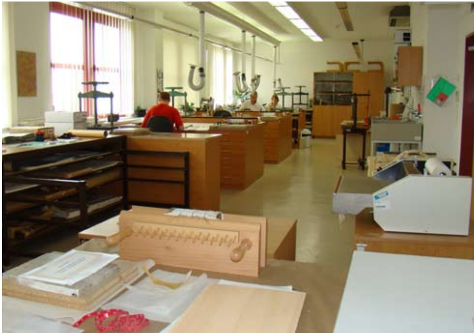
Палітурна майстерня Народного архіву.