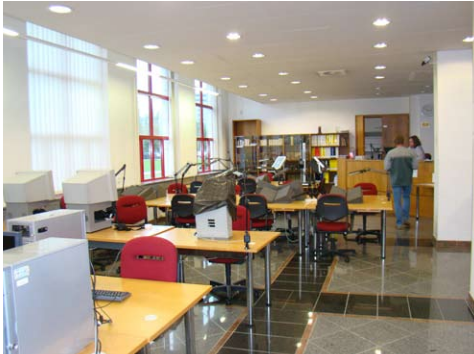
Читальний зал Архіву головного міста Праги.

Відвідуючи Народний архів Чеської республіки та Архів головного міста Праги, українська делегація ознайомила з історією комплексу архівних споруд “Архівний ареал” в районі Ходова (Прага 4). Зведення даного комплексу розпочалося після страйку працівників архівних установ Праги, котрі вимагали покращення умов праці та зберігання документів, централізації архівів, які на той момент розташовувалися в пристосованих приміщеннях, розпорошених по місту. Так, наприклад, Центральний державний архів (з 2005 р. – Народний архів Чеської республіки) розташовувався в 13 старих будівлях. Під тиском архівної спільноти уряд Чеської республіки 27 квітня 1992 р. приймає постанову № 385 про будівництво нових приміщень для архівів. Таким чином, 20 жовтня 1992 р. розпочинається будівництво першого корпусу архівних споруд, а з 30 червня 1995 р. – другого корпусу за проектом архітектора Іви Кнаппової. У будівництві була використана залізобетонна система стінових несучих конструкцій т. зв. “LOB monolit”. Кожна така несуча конструкція фактично являла собою залізобетонні стовпи розміром 30x30 см, розташовані один від одного на відстані 1 м*. Стіни будівлі виконано з монолітного бетону (5 см), покритого спеціальним