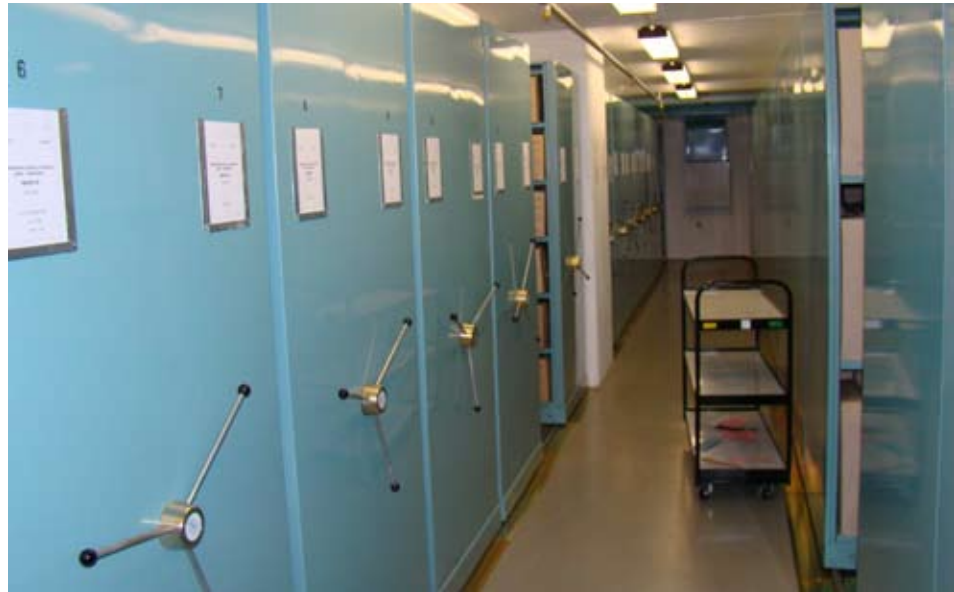
Пересувні архівні стелажі Народного архіву.

мії наук та Інституту Масарика щодо їх участі у підготовці українсько-чеської частини міжархівного довідника “Зарубіжна архівна україніка”. Також керівництво Народного архіву, Архіву Чеської академії наук та Інституту Масарика погодилося сприяти організації виявлення та опрацювання документів української громади у Чехії міжвоєнного періоду, а також підготовці за результатами цієї роботи спільного видання – каталогу фондів української еміграції, що зберігаються у цих архівах.