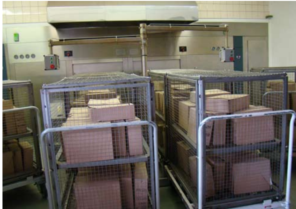
Дезінфекційна камера Народного архіву.

Враховуючи, що одним з основних завдань кожного архіву є не лише забезпечення збереженості архівних документів, але й формування архівних фондів новими документами, при проектуванні будівель “Архівного ареалу” було заплановано відведення значних приміщень для проведення попередньої архівної обробки документів. Зокрема, в першому корпусі під це було відведено 4 приміщення загальною площею 240 м 2 , а в другому – 2 приміщення площею 325 м 2 .