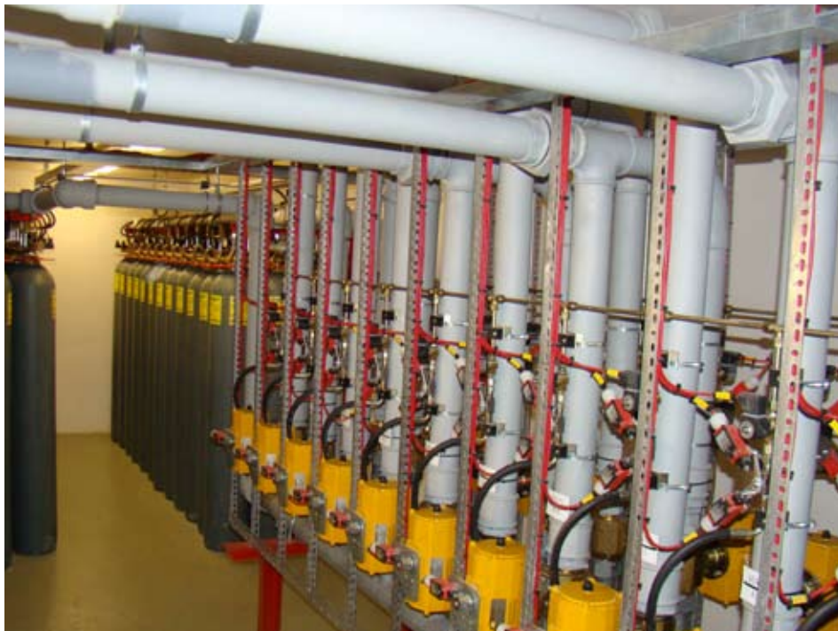
Система пожежогасіння сховищ Народного архіву.

утеплювачем (80 см). Зовні стіни покрили спеціальною кольоровою керамічною плиткою, яка не лише має естетичний вигляд, але й дозволяє значно понизити втрату тепла.