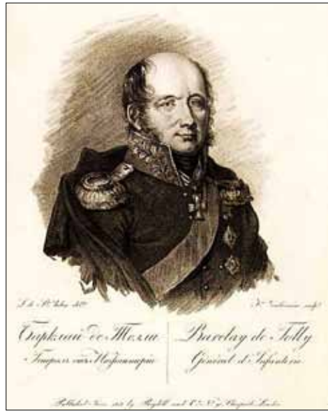
М. Б. Баркляя-де-Толлі. Портрет роботи Ф. Вендраміні. 1813 г.

Ключові слова: М. Б. Баркляя-де-Толлі; Наполеон I; Перша західна армія; фонд; Франко-російська війна 1812 р.