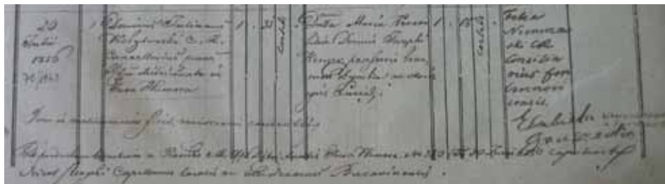
Актовий запис про шлюб батьків Ольги Юліанівни Кобилянської, виявлений в Книзі реєстрації актів про шлюб громадян греко-католицького віросповідання по с. Глибока від 20 липня 1856 р. Держархів Чернівецької обл., ф. 1245, оп. 1, спр. 954, арк. 63в.–7 (публікується вперше).

Шукала себе в музиці (грала на фортепіано, цитрі, дрімбі), непогано малювала і грала в театрі. Хотіла навіть стати професійною акторкою, але віддала перевагу літературі. Була людиною з європейським мисленням, її хвилювало питання емансипації – вважала його віянням часу 1 . Перебування в німецько-румунському середовищі (територія Буковини до 1918 р. входила до складу Австро-Угорщини, а Південна Буковина населена переважно румунами) стало причиною того, що перші вірші тринадцятирічної майбутньої письменниці написані німецькою мовою. У 1880 р. написане перше німецькомовне оповідання О. Кобилянської “Гортенза, або нарис з життя однієї дівчини”, у 1883 р. – “Воля чи доля”. Потім були створені алегоричні замальовки “Видиво” (1885), “Голка і дуб” (1886), оповідання “Вона вийшла заміж” (1886–1887). У 1888 р. О. Кобилянська почала писати німецькою мовою повість “Лорелай”, яка в 1896 р. була опублікована українською мовою під назвою “Царівна”. Саме завдяки цій повісті з нею як письменницею знайомиться Леся Українка, яка прочитала рукопис й відтоді пильно стежила за її творчим зростанням. Між письменницями зав’язалось тісне листування та дружні стосунки, і навесні 1901 р. Леся Українка гостювала у своїй подруги на Буковині 2 .