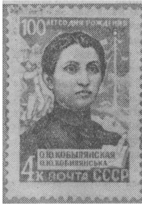
Поштова марка із зображенням Ольги Кобилянської, випущена до 100-річчя з дня народження письменниці та опублікована в газеті “Радянська Буковина” від 27.11.1963, № 235 (5361), с. 2.

лу “Промінь”, місячником “Нові шляхи”, з видавництвом “Рух” (Харків), де у 1927–1929 рр. вийшли друком її твори в 9-ти томах. Чернівецькі україномовні часописи “Каменярі”, “Рідний край”, “Час”, “Самостійна думка”, “Хліборобська правда” 1920–1930-х рр. публікують на своїх шпальтах твори та статті О. Кобилянської, присвяти та програми святкування 35-річного (1922) та 40-річного (1927) ювілеїв літературної діяльності письменниці, повідомлення про її перебування на лікуванні за кордоном тощо.