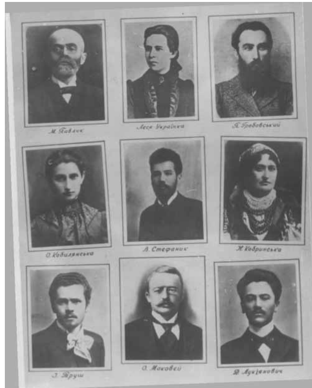
Фото діячів культури (серед них Ольга Кобилянська), які вітали І. Франка у 1898 році з 25-річчям його літературної та громадсько-політичної діяльності. Фоторепродукція 1966 р. (0-4825).

На виконання Постанови Президії Верховної Ради УРСР від 2 грудня 1940 № 339 “Про асигнування коштів на святкування 55-літнього ювілею літературної діяльності О. Ю. Кобилянської” 8 в Чернівцях відбулись урочистості, присвячені діяльності видатної буковинки. Їй передувала Постанова Президії Верховної Ради УРСР від 27 серпня 1940 “Про надання допомоги члену спілки радянських письменників О. Ю. Кобилянській, що проживає на території Північної Буковини” 9 , на підставі якої письменниці було виділено 10 тис. карбованців. У документах архівного фонду Чернівецької обласної ради зберігається розписка Кобилянської від 2 вересня 1940 р. про отримання нею матеріальної допомоги.