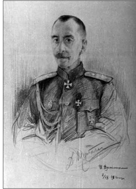
І. К. Дряпаченко. Портрет генерала Д. Г. Щербачова (1857–1932) з автографом, 1916, папір, кол. ол., сангіна, 45×30, Державний історичний музей (РФ). Фото у ЦДАМЛМ, ф. 290, оп. 1, стр. 361, арк. 41.

Під час Першої світової війни з 1916 по 1917 рр. І. Дряпаченко перебував за призовом у складі особового воєнно-художнього загону “Трофейної комісії”. До її складу також входили: художники М. Мі-