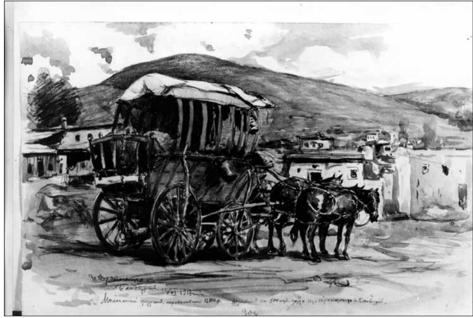
І. К. Дряпаченко. Стоянка Молоканського вільнонайманого транспорту біля гірської річки Чорох по дорозі Байбурт-Трапезонд, 1917, папір, акварель, італ. ол., 30×45,5. Державний історичний музей (РФ). Фото у ЦДАМЛМ, ф. 1144, оп. 1, спр. 4, арк. 32.

При этом его императорскому величеству благоугодно было обратить милостивое внимание на акварельную виньетку, исполненную крестьянином Иваном Дряпаченко и пожаловать ему золотые часы из кабинета его величества” 11 .