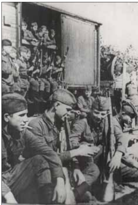
Добровольцы отправляются на фронт. 1941 г.

Немецкие оккупанты устанавливали строжайший режим пребывания населения на улице. Запрещалось собираться группами, проводить собрания, петь, посещать кино и т.д. Для взятия на учет всех трудоспособных проводилась обязательная регистрация населения на биржах труда. Из приказа Ворошиловградской областной биржи труда “О регистрации трудоспособного населения” от 18 августа 1942 года: “... Всему трудоспособному гражданскому населению, не зарегистрировавшемуся на бирже, немедленно пройти регистрацию. Лица не прошедшие регистрацию до 15 сентября 1942 года, будут оштрафованы на 500 рублей каждый... Граждане, не зарегистрировавшиеся на бирже, а работающие на предприятиях и организациях, подлежат штрафованию на 500 рублей или принудительной работы на 2 месяца...” 74 .