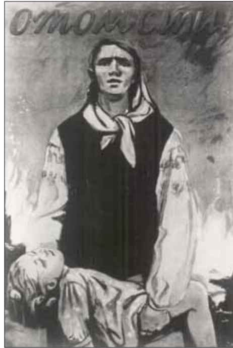
Политический плакат "Отомсти!" Госархив Луганской обл., ф. П-7118, оп. 1, д. 742.

сокрушительные удары по гитлеровским войскам на всех участках фронта. Недалек час, когда Красная Армия перейдет в контрнаступление и освободит наш славный город от гитлеровской нечисти.