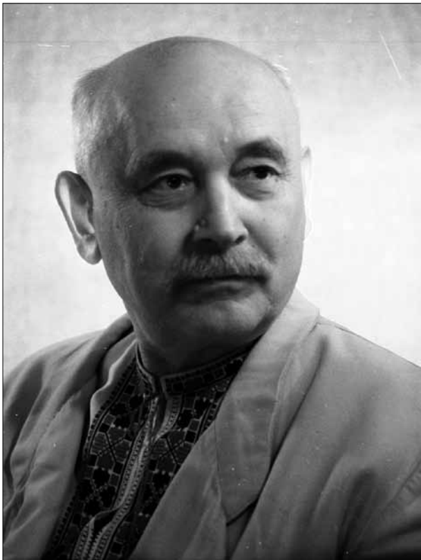
Г. Г. Верьовка – український композитор і хоровий диригент, педагог, народний артист УРСР. 1962 р.