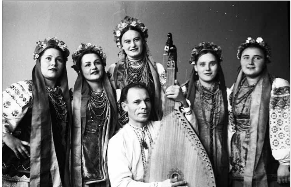
Група артистів Державного українського народного хору під час виступу в Московській військово-політичній академії ім. В. І. Леніна. м. Москва, 3 листопада 1946 р.

Пропонуємо добірку фотодокументів із фондів ЦДКФФА України ім. Г. С. Пшеничного.