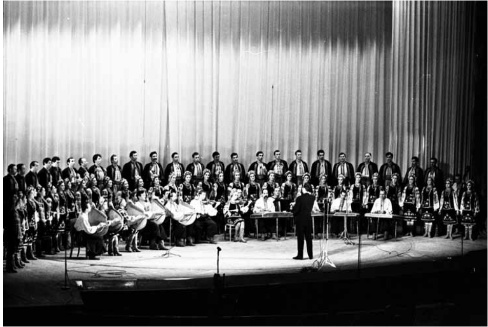
Виступ Державного заслуженого українського народного хору ім. Г. Верьовки. м. Київ, 2 березня, 1970 р.

ЦДКФФА України ім. Г. С. Пиєничного од. обл. 0-151437.