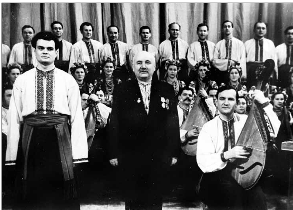
Державний український народний хор під час виступу. Зліва направо: М. К. Кондратюк, художній керівник і диригент Г. Г. Верьовка. м. Київ, 1952 р. од. обл. 2-133790.