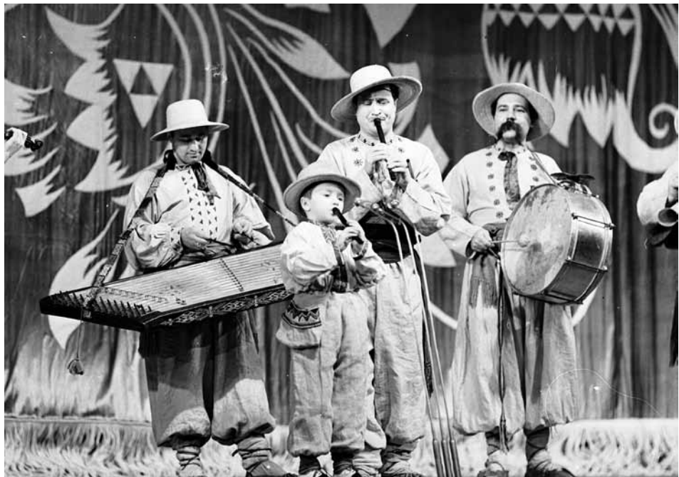
Музична картинка “Троїсті музики” у виконанні артистів оркестру Державного заслуженого українського народного хору ім. Г. Верьовки. м. Київ, 10 березня, 1972 р.