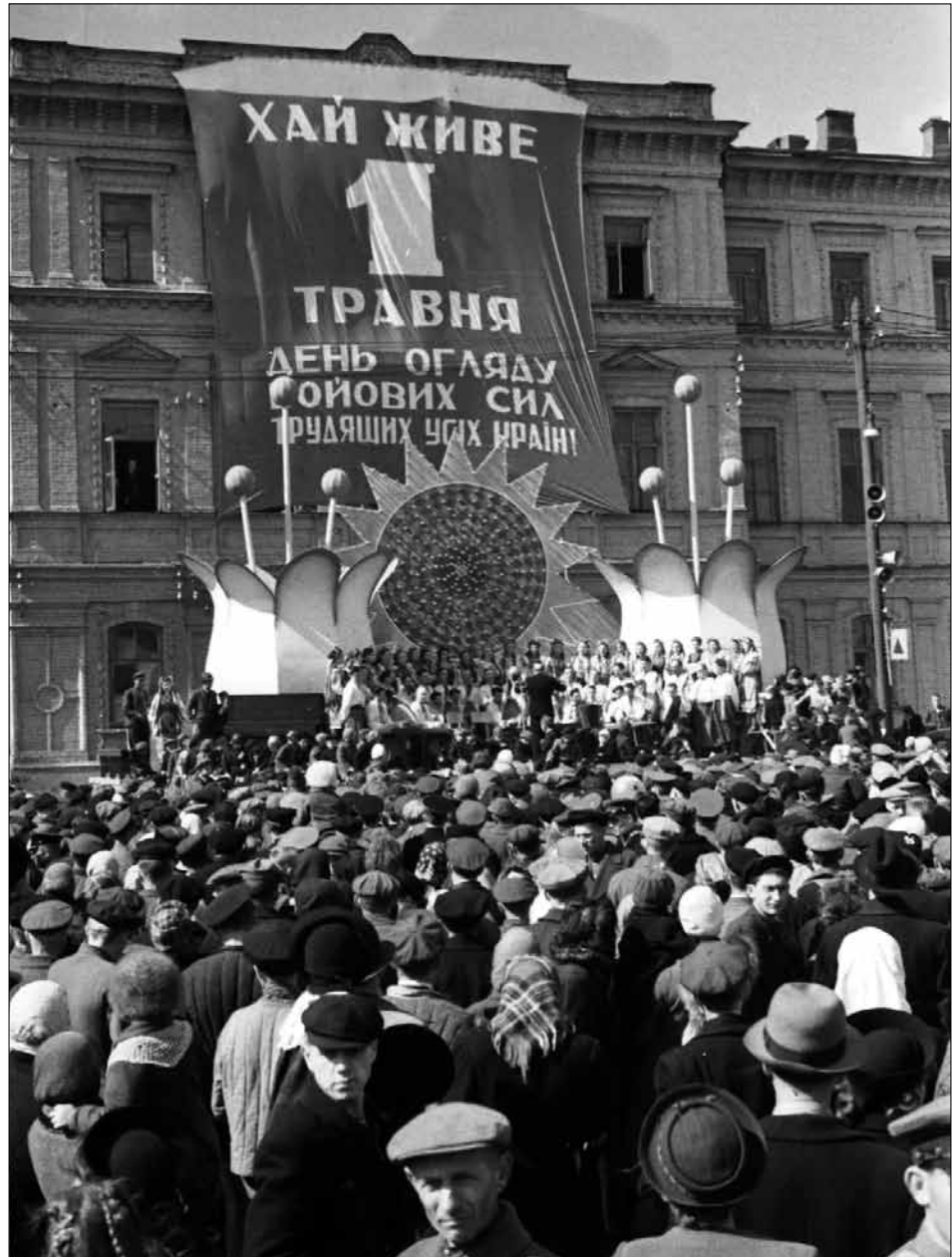
Виступ Державного українського народного хору під орудою заслуженого діяча мистецтв Г. Г. Верьовки на пл. Богдана Хмельницького в день відкриття передсвяткового першотравневого вуличного базару.