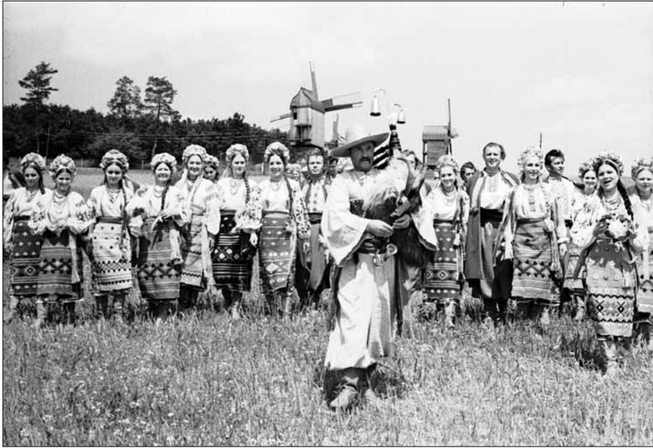
Виступ Державного заслуженого українського народного хору ім. Г. Верьовки у Музеї народної архітектури та побуту УРСР. м. Київ, 1980-і рр.

Тематический обзор представляет аудиовизуальные документы из фондов ЦГКФФА Украины имени Г. С. Пшеничного, которые освещают творческий путь Национального заслуженного академического украинского народного хора им. Г. Веревки.