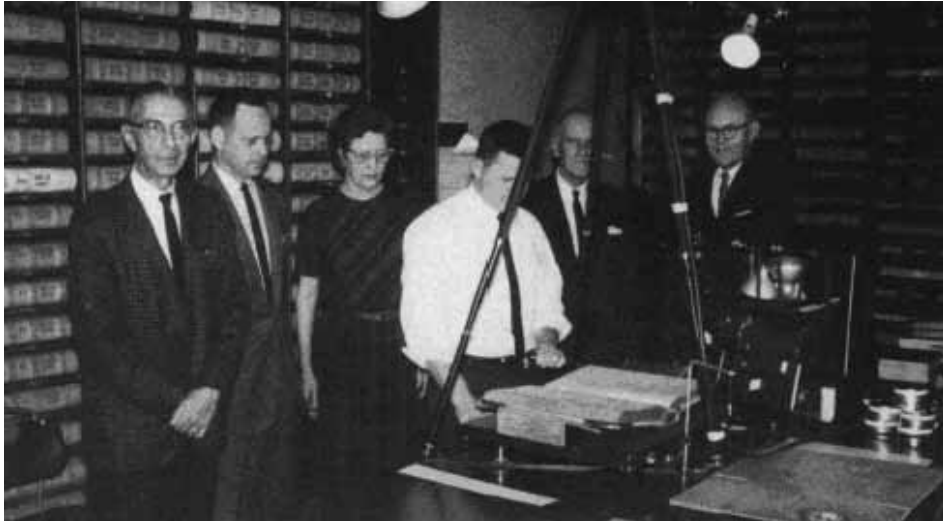
Мікрофільмування документів у суді округу Джонстоун (Johnston), штат Північна Кароліна.