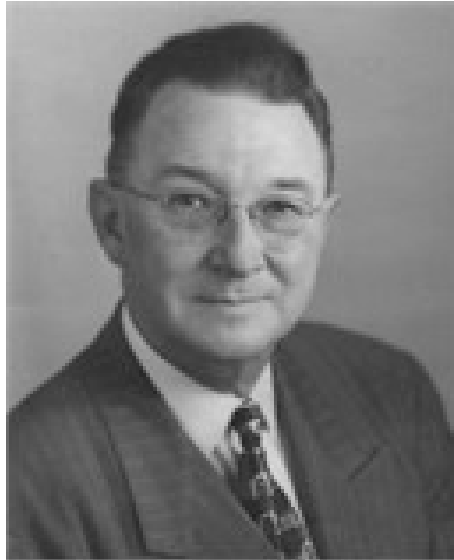
Альберт Рей Ньюсом, Секретар Історичної комісії Північної Кароліни, 1-й Президент Товариства американських архівістів (Федерація історичних товариств Північної Кароліни [Електронний ресурс] // Режим доступу: http://www. fnchs.org/fund/newsome-award.htm

1945 рр. – 9-м віце-президентом, 1947–1949 рр. – 6-м Президентом Товариства американських архівістів; протягом 1946–1947 рр. та 1950–1954 рр. вчений входив до складу Ради Товариства американських архівістів. Під його керівництвом Комісія була перейменована на Департамент архівів і історії (архів так називався у 1943–1972 50 ) та збільшено її штат з 8 до 135 осіб (таке збільшення штату пояснюється тим, що то були роки “Нового курсу” * і до роботи в архівах залучалась значна кількість безробітних істориків); законом про збереження публічних документів “An Act to Safeguard Public Records in North Carolina” (1935) впроваджено програми управління документацією в установах, музейні та охорони культурних ресурсів програми 51 . 1968 р. К. Кріттенден перевів свій архів до нового будинку і обійняв посаду помічника директора через стан здоров’я 52 .