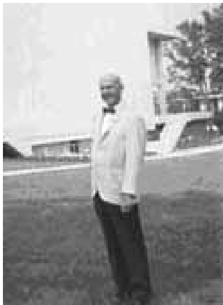
Крістофер Кріттенден, Секретар Історичної комісії штату Північна Кароліна у 1935–1968 рр., 1-й Президент Американської асоціації історії штатів і округів; 9-й віце-президент (1944–1945 рр.), 6-й Президент Товариства американських архівістів (1947–1949 рр.), біля нового будинку Департаменту архівів і історії Північної Кароліни

у ході проекту описи документів округів. На проекті працювало більше сотні співробітників. Крім укладання описів, вони займались систематизацією документів в установах округів.