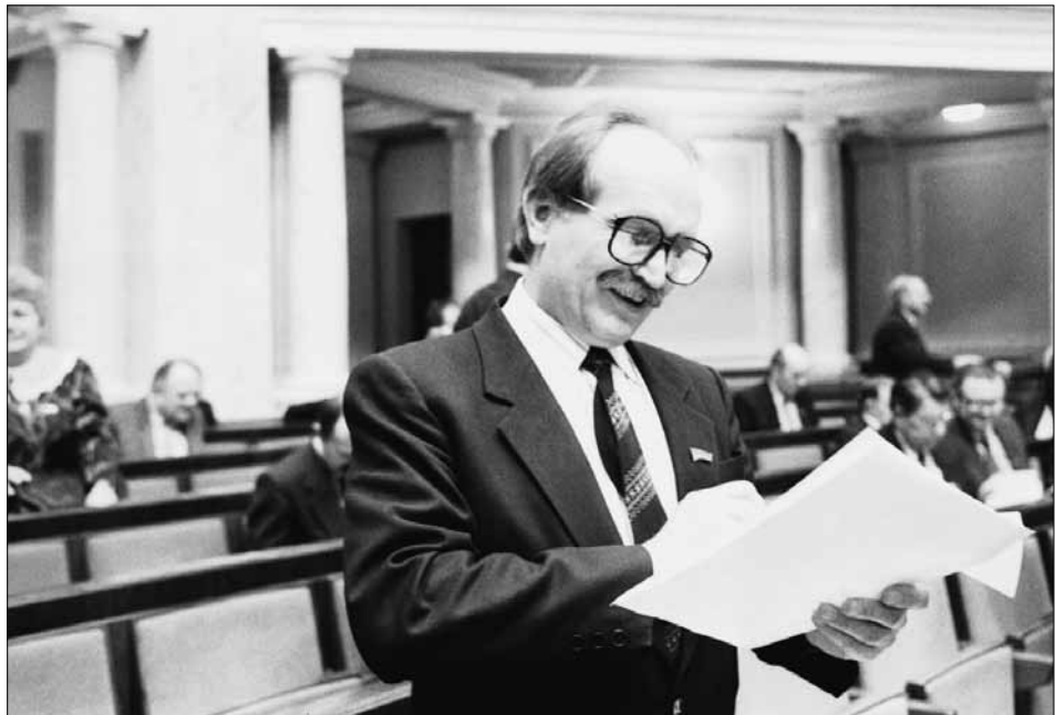
Голова Львівської обласної ради В. М. Чорновіл у залі засідань Верховної Ради УРСР. м. Київ, лютий 1991 р. Фото Я. Б. Давидзона.

ЦДКФФА України ім. Г. С. Пшеничного, од. обл. 0-220463.