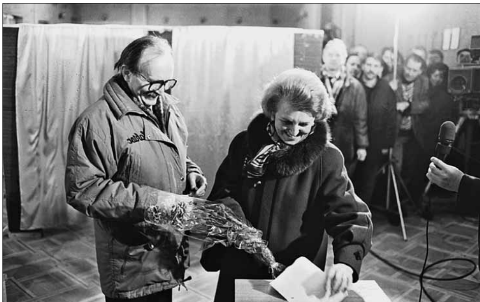
Кандидат у президенти України, голова Львівської облради В. М. Чорновіл з дружиною А. В. Пашко на виборчій дільниці під час Всенародного референдуму і виборів Президента України.

м. Львів, 1 грудня 1991 р.