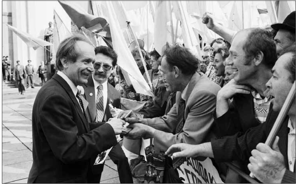
Народні депутати України В. М. Чорновіл (ліворуч) і О. Є. Шевченко (праворуч) з пікетувальниками біля будинку Верховної Ради УРСР. м. Київ, червень-липень 1990 р.