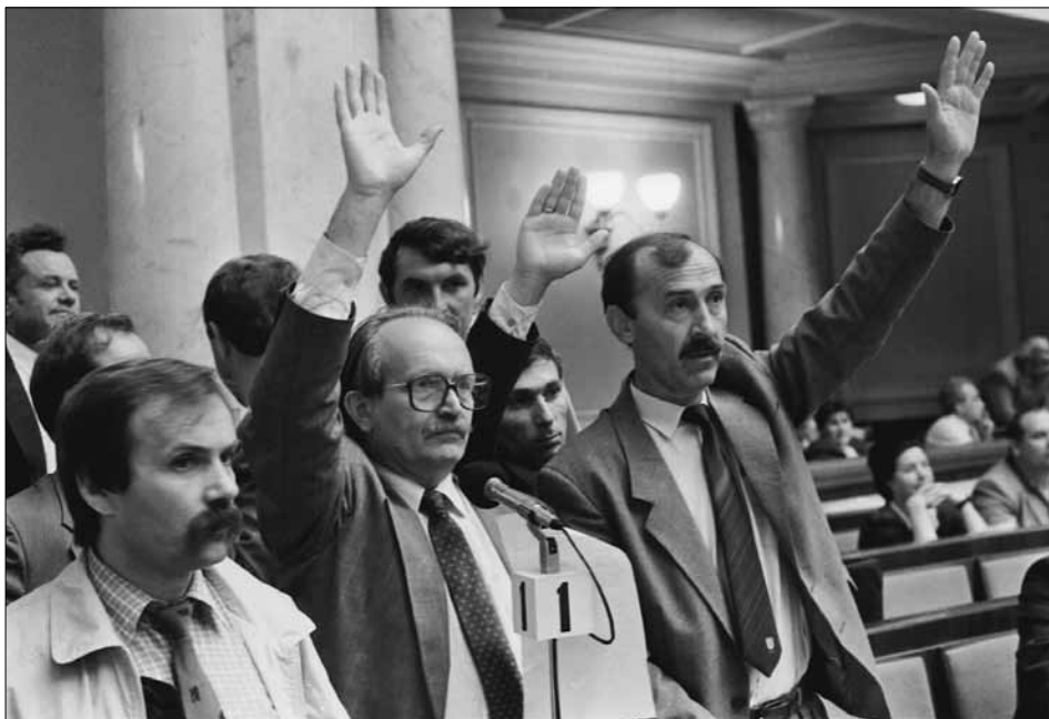
Народний депутат України В. М. Чорновіл (2-й ліворуч) у залі засідань Верховної Ради України. м. Київ, 7 липня 1992 р.