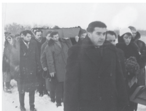
Є. О. Сверстюк із друзями-однодумцями несе труну В. А. Симоненка. Черкаси, грудень 1963 р. ЦДАМЛМ України, ф. 1153, оп. 1, од. зб. 21.