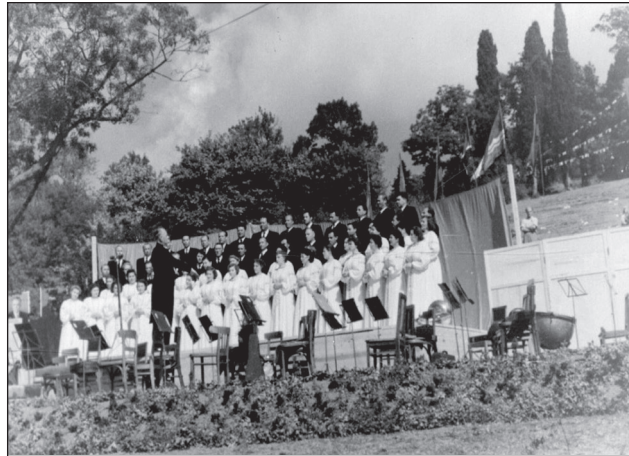
Фото капели «ДУМКА» в Парижі. 1929 р.

У 1936 р. разом із Київським театром опери і балету ім. Тараса Шевченка «ДУМКА» брала участь у декаді українського мистецтва в Москві. Усього за цей рік капела провела 132 концерти. Після того, як наступного року новим диригентом «ДУМКИ» було призначено О. Н. Сороку, у її діяльності від-