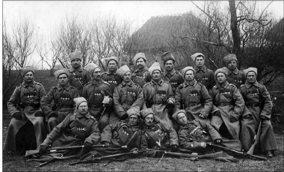
Група солдат – георгіївських кавалерів III кінного корпусу на одній із ділянок фронту. 1915 р.

кий зріст, вовча папаха, стара солдатська шинель тощо. Та обставина, що ця особа не була вказана на жодному із знімків, наштотувала на думку, що перед нами – власник альбому, який, напевно, і є командиром вищезгаданих військових підрозділів. Звернувшись до історичних джерел і публікацій, порівнявши альбомні світлини з оприлюдненими фотографіями генерала Ф. А. Келлера, отримали підтвердження своїм здогадам.