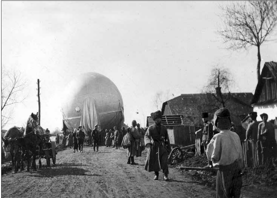
Транспортування змійкового повітроплавного аеростату (83) 30-го корпусного авіаційного загону, прикріпленого до III кінного корпусу. [м. Новоселиця Хотинського повіту Бессарабської губернії (нині Чернівецької області)], 1916 р.

фотографії супроводжуються й авторськими підтекстівками Ф. А. Келлера. У них без змін, мовою оригіналу, збережено особливості написання прізвищ, звань, назв військових підрозділів, населених пунктів, дат.