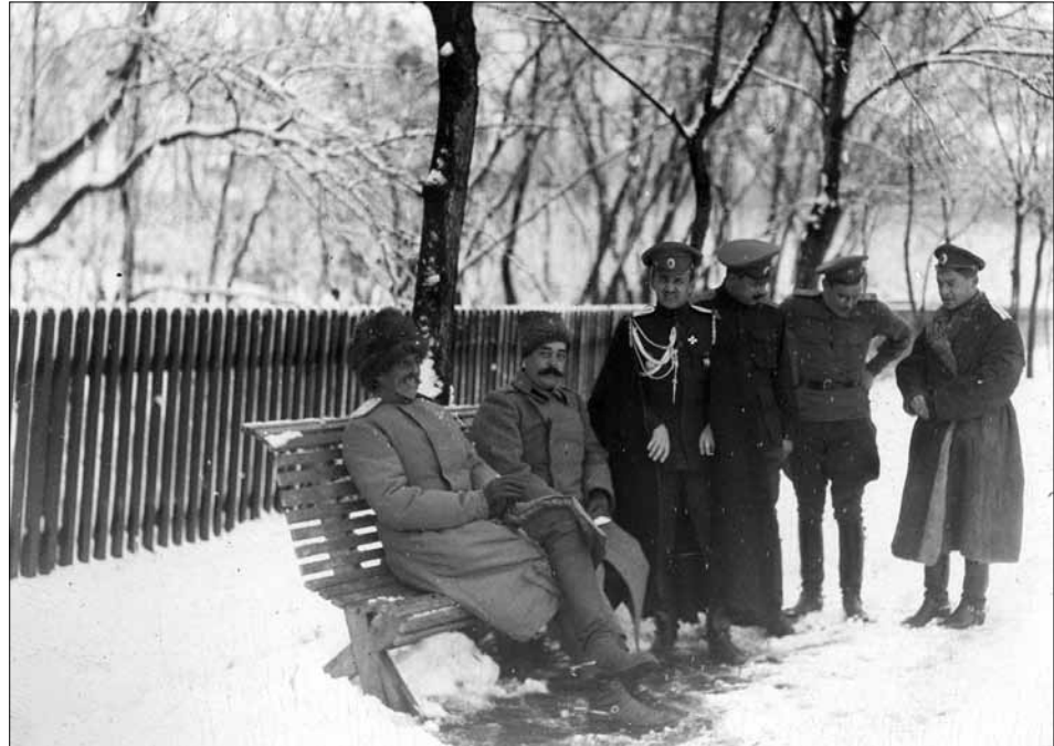
Офіцери штабу III кінного корпусу. Зліва направо: командир корпусу, генерал-лейтенант граф Ф. А. Келлер, [полковник М. В.] Лескарев, старший ад'ютант штабу, капітан О. В. Сливинський, ротмістр Щербачов, [ротмістр 10-го драгунського Новгородського полку Г. А.] Валуєв (65). м. Новоселиця Хотинського повіту Бессарабської губернії (нині Чернівецької області), 1915 р.

ся, що видання альбому не тільки розширить джерелознавчу базу історичних досліджень, але й сформує нові запитання перед дослідниками, фахівцями, знавцями фотографічного мистецтва.