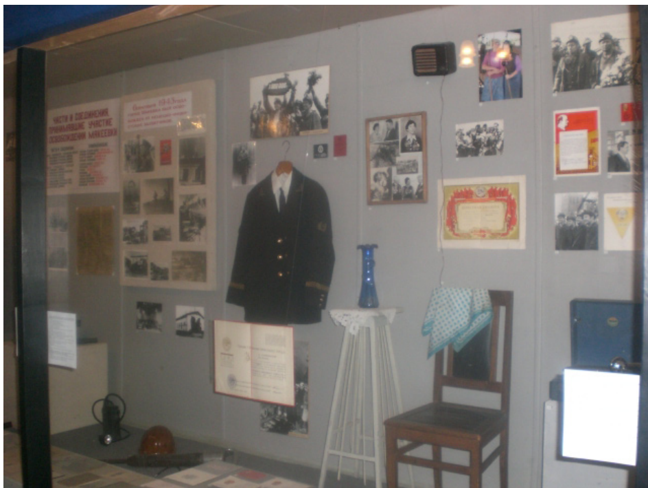
Фрагмент виставки в Макіївському міському художньо-краснознавчому музеї

Естафету виставкової роботи прийняли усі архівні установи області. Цим заходам передувала копітка і тривала робота з виявлення та збору архівних документів, підготовки тематичних планів, спілкування зі свідками подій тих років, перегляду сімейних фондів тощо. Наприклад, архівістами проведено виявлення документів у Держархіві області у фондах сільських управ періоду окупації області та виконкомів міст і районів, а також в особових фондах учасників війни ( Волноваський район), фондах архівних відділів (Артемівський район, м. Горлівка), у фонді КП «Музей бойової слави», у колекції документів «Історія виникнення та розвитку міста Сніжного» (м. Сніжне), у сімейних фондах учасників війни (м. Маріуполь). Проведено зустрічі з головами громадських ветеранських організацій, бесіди з ветеранами війни, учасниками підпільного руху в Донбасі.